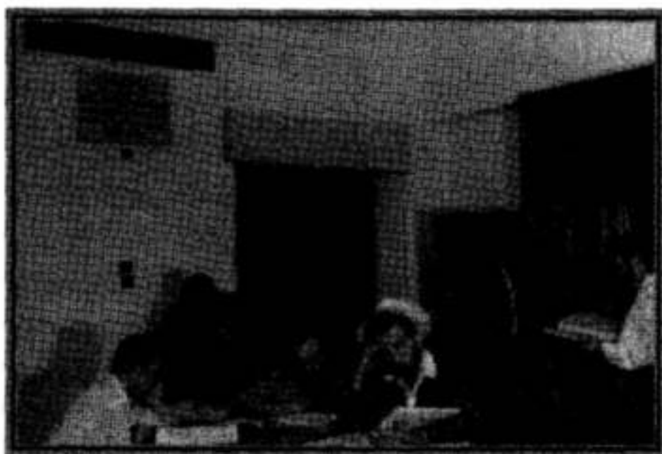
אוצר הספרים של ימי הבראשית

האם ישנו עוד ראש ישיבה שדאג לכל הפרטים הקטנים כמוהו?! אבל לדאגה הזאת היו תוצאות עוד בחודש אייר של שנת תשי"ב היה ארוע גדול בחיי התורה בירושלים. אולי באותה שנה לא הותיר המאורע רושם בל ימחה על חכמי ירושלים אבל הזרע שנשתל באותו יום עתיד היה להשפיע על השנים הבאות ולתת צביון אדיר לשכונת בית ישראל במיוחד.