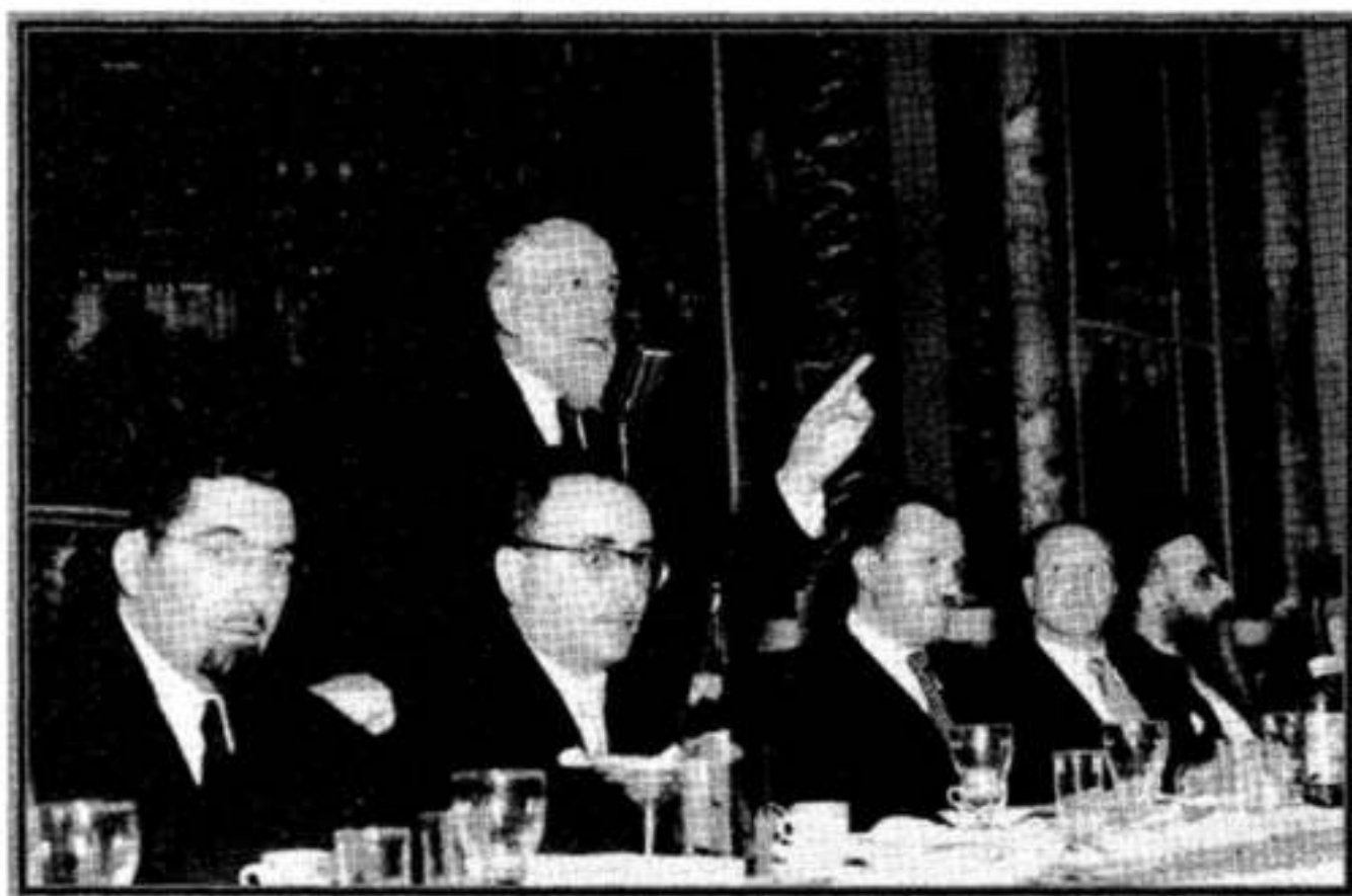
בשולחן המזרח של הדינר: האבא מימין

אבל למעשה כבר היה האבא בארה"ב עוד מלפני פסח כי בחול המועד פסח התקיים כינוס כללי לתורה ולמוסר בבית הכנסת "עדת ישראל" באיסט ברודוויי 201, ניו יורק.