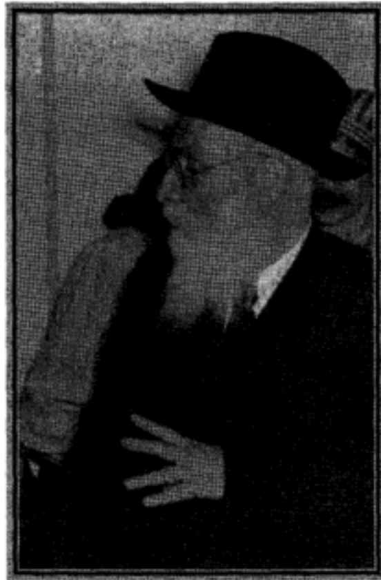
הסבא בקבלת הפנים למשפחת קויפמן

אנדערע. ער קען ניט ריידן און ער רעט בעסער ווי אנדערע.... (ראש ישיבת מיר אינו יכול לעשות כסף ועושה יותר טוב מאחרים, הוא לא יכול לנאום ונואם טוב יותר מאחרים).