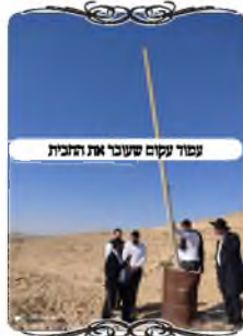
עמוד עקום שעביו את החבית

בעמוד אחר היתה בעיה אחרת, שהעמוד היה בתוך חבית, אבל הוא עמד עקום מאוד, בצורה שראשו עובר את רוחב החבית והנה יש מקרים שהחבית מועילה לשמש כמו עמוד מדן לחי, ואז גם אם בעמוד יש בעיה, החבית משמשת במקומו. אבל זה דוקא כשהחוט מכונן מעל החבית, משא"כ כשהעמוד נוטה יותר מרוחב החבית, אין החבית יכולה לשמש ללחי, ושוב הרי זה עמוד עקום.