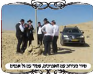
סיוע בעירוב עם האברכים, נסוע עם גל אביב

במסגרת בדיקת עירובים נסענו אל אחת הערים בדרום, על פי בקשת הקהילה, על מנת לסייע לאחראים על העירובים לדעת כיצד לשפר את העירוב, ולשים לב לדברים שלא הבחינו בהם שהשתנו, או נעשו מראש בצורה לא נכונה, עד כדי חשש פסול.