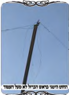
חוט חזק בראש הבדול לא מעל העמוד

לאחר שעברנו את רוב העיר, והגענו כמעט למסקנה מסוימת, שיש עירוב ברמה נמוכה, הופתענו לגלות שינוי חמור בשלושה עמודים. עמוד אחד שעמד ליד אזור בניה, עמד עקום מאוד, וניכר היה שהוא נעקר ממקומו ושתלו אותו בתוך ערימת חול ואבנים.