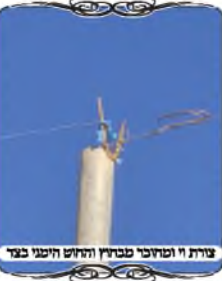
צורת וי וטחית פסולת החוט חזק בראש

בשני העמודים הבאים היה כבר שינוי בצורת הראש, שעשו לו וי, אבל הלחימו אותו מהצד החיצוני של העמוד. זה מפליא לראות, שעושים בידיים מלכתחילה עמוד עירוב בצורה פסולה. איך יתכן שאדם כבר יודע לעשות צורת וי ועושה אותה מהצד. הדברים האלו נעשים בגלל שנותנים את העבודה לבעלי מלאכה שאינם מיוחדים למלאכת העירוב, וממילא יוצאות טעויות כל כך פשוטות, שפוסלות את העירוב לגמרי.