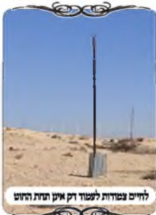
לחיים בנפשות לעמוד דק אין תחת החוט

לעמוד, יוצא שהחוט יהיה מעט על העמוד, אבל מספיק שיהיה הבדל של מילימטר אחד רווח שהוא מקום ההלחמה, יוצא שהחוט שעביו מילימטר או שניים, כבר לא מעל העמוד. בחלק מהעמודים ראינו שהאחראי חשש והוסיף לחיים, אבל כיון שבנוסף לבעיה זו העמודים היו דקים, הם התעקמו באופן שהלחי לא היה כלל תחת החוט. בדקנו כל עמוד ועמוד, והתוצאה שלא רואים מקום פסול, אבל בהחלט זה יכול לקרות כשהחוט ימשך לכיוון אחר של העמוד. שאלו האברכים מה הפתרון לבעיה זו. אמרנו להם להחליף לעמודים תקינים.