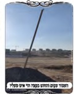
העמוד עקום והחוט בקצה הוי אינו מעל

אמנם באופן שיש על המדרגה שטח ישר ברוחב ד' טפחים, אין בעיה שהעמוד על המדרגה, כי המדרגה היא ג"כ קרקע בשיעור רשות, והעמוד אינו גבוה מהקרקע, אבל באופן שאין ברוחב המדרגה ד' טפחים, הרי בהכרח שקרקע הרשות היא למטה, וממילא יוצא שהעמוד גבוה מהקרקע. במקרה זה היה הבדל בין שני הצדדים של העמוד, בחוט שמגיע משמאל, היה לפני העמוד רוחב ד', אבל תחת החוט היוצא לימין לא היה רוחב ד' טפחים.