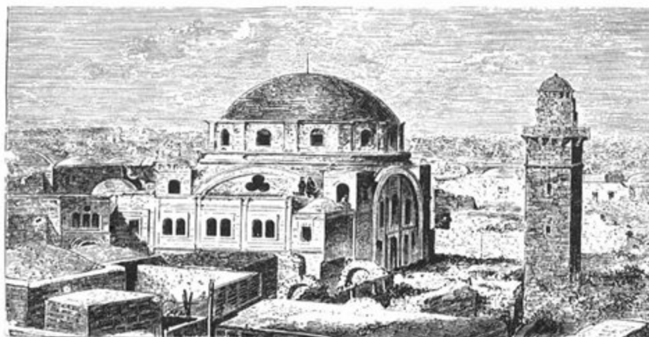
בניין חצר 'החורבה' ובית הכנסת 'בית יעקב', 1837-1864.