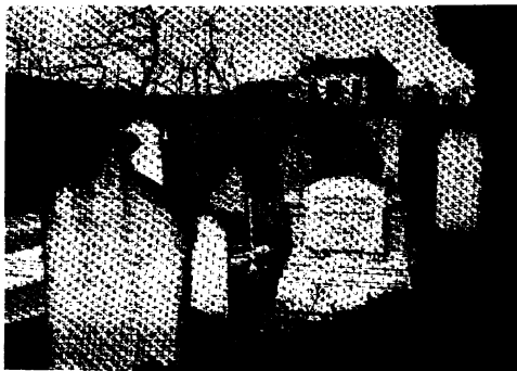
בית העלמין של קהילת לוגו