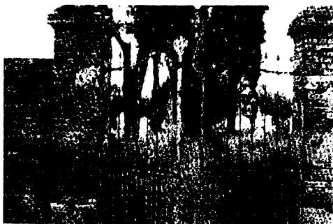
שער בית הקברות