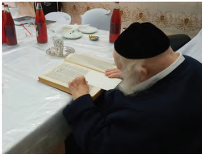
לומדי 'שיח התורה' משיבים טובה להרב זצוק"ל בדבר שמסר עליו את כל חייו, אהבת ושקידת התורה. הרב זצוק"ל מתחיל את לימוד הש"ס בערב פסח לצד שולחן ליל הסדר הערוך.

הדי הערכה והתפעלות נשמעים בעולם התורה לכבודה של תורה, בגודל מעלת בני העליה, כשב'שיח התורה' קוראים לקהל חובשי בתי המדרשות, להצטרף ללגיטו של מלך, במסלול 'בדרכו' ההולך לפני המחנה, או לכלל מסלולי הלימוד של 'שיח התורה'. ההצטרפות בטלפון 03-308-5000, או בעמדות 'נדרים פלוס'