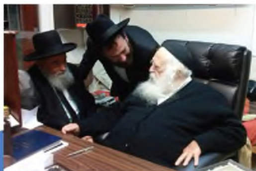
אאמו"ר שליט"א סיפר הרב עם אביו של הרב"א שליט"א - הגמ"ח שליט"א

סיפור נוסף בענין ידיעת התורה, והוא גם ממחיש כמה כל חייו של הרב לא היה לו בעולמו אלא תורה ומצוותיה, וכל מה שכתב בחז"ל הרי זה במוחשי וקיים אצלו, ולכל דבר מצא מקור וסיבה, היה זה כאשר באו לבשרו על הולדת בן נינו הראשון, הרבנית ע"ה התרגשה מאוד, והיתה