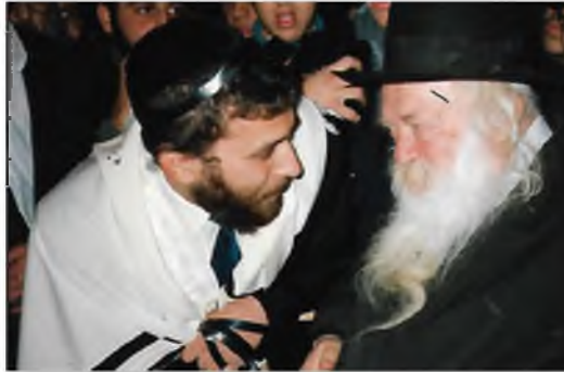
תביא לאבא שלך. הרב"א שליט"א עם הרב בבית לבנו בכורי

זכורני בברית של בני בכורי, שהתקיימה בירושלים בעיר העתיקה בבית כנסת 'הרמב"ן', הרב הגיע, כמובן שכבר לפני הלידה, היה ברור שהרב יהיה הסנדק ע"ד אאמו"ר ומו"ח שליט"א, הרב בענותנותו, אמר לי כל הזמן: 'תביא לאבא שלך', והוא הגיע לברית כביכול רק ע"ד להשתתף, אבל כמובן ששם כבר אמר לו אבי בפירוש, שהוא רוצה שיהיה סנדק, הרב הפטיר לי בחדוות: 'א"כ עכשיו זה כבר כיבוד קיבלתי מאביך, אתה תצטרך לתת לי שוב בילד אחר', בבני הרביעי, לאחר שאאמו"ר ומו"ח שליט"א כובדו בנסדקאות, באתי באמת להרב לבקש ממנו שיהיה סנדק, כפי שאמר