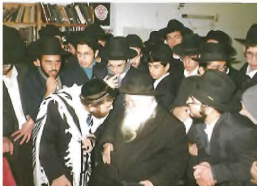
בבית לבנו בכורו של הגרי"א שליט"א, תיק הסלית נראה בידי הרב