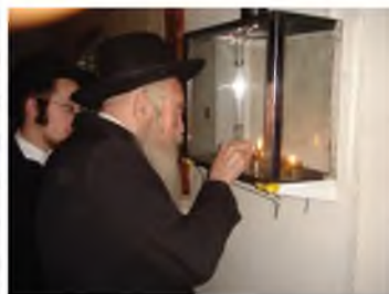
רבי יהודה בהדלקת נרות חנוכה

ובהלכות שמיטה כתב רבינו: הא דצריך להוציא לחוץ בזמן הביעור, העיד ר"י שפירא בשם מרן החזון איש שהוא דוקא במפקיר ביום האחרון, אבל אם מפקיר קודם לכן אין צריך להוציא (וכמובן שזה בתנאי שלא יחזור ויזכה בו עד זמן הביעור).