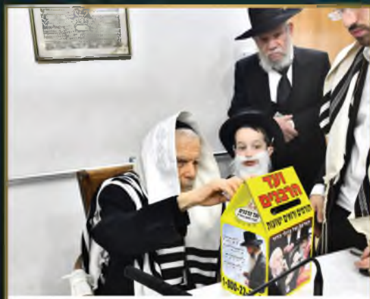
מרן ראש הישיבה זצוק"ל במתנות לאביונים לוועד הרבנים פורים תשפ"ב