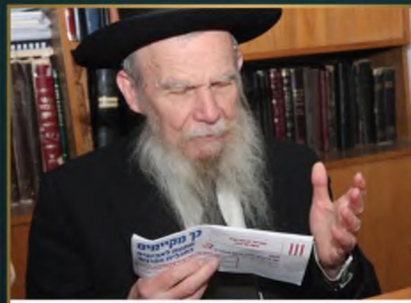
מרן ראש הישיבה זצוק"ל במתנות לאביונים לוועד הרבנים פורים תשס"ט