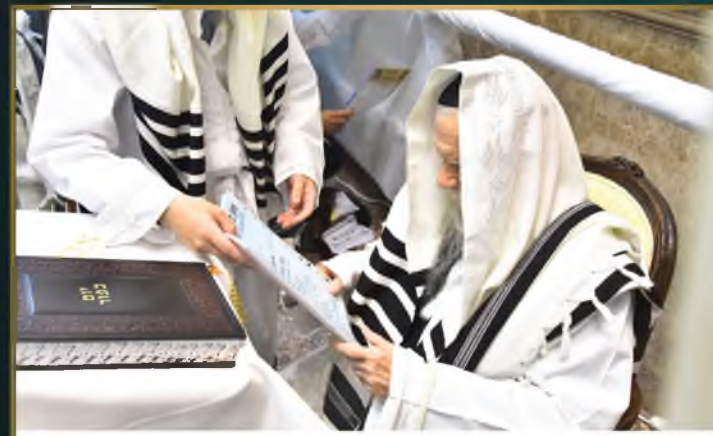
מרן ראש הישיבה זצוק"ל מעתיר על תורמי ועד הרבנים בערב יום כפור תשפ"ב