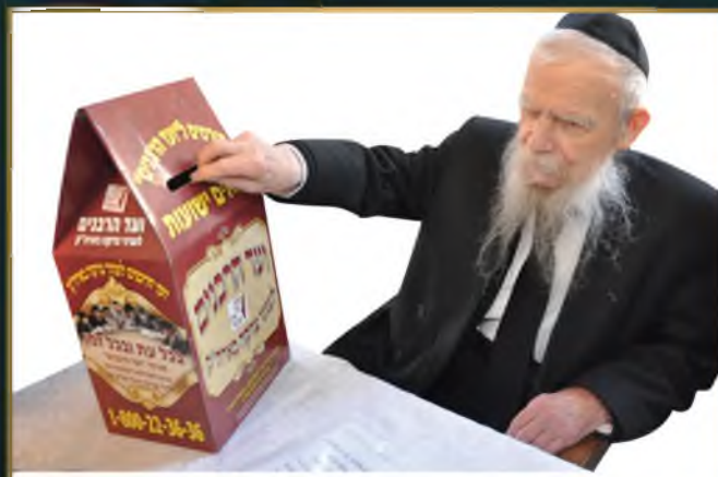
30 שנה בראשות ועד הרבנים לעניני צדקה בארה"ק