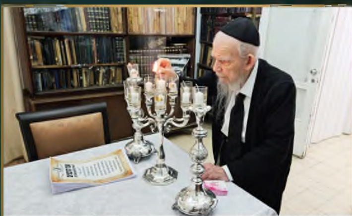
התמונה האחרונה: מרן מתפלל על תורמי "ועד הרבנים" בהדלקת נר ערב שביעי של פסח תשפ"ג