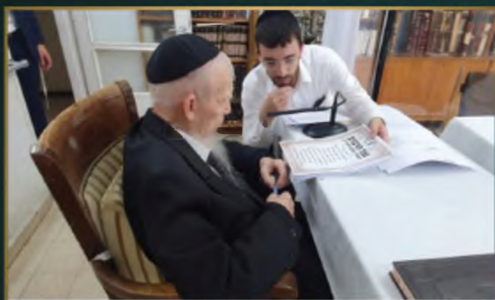
מרן ראש הישיבה זצוק"ל מתפלל "תפילת השליה" על תורמי "ועד הרבנים" בער"ח סיון

שלושים שנות הנהגת רשכבה"ג מרן ראש הישיבה הגאון הגדול רבי ירחמיאל גרשון אדלשטיין זצוק"ל בראשות ועד הרבנים לעניני צדקה בארה"ק, אשר היתה משויש ליבו כל ימי חייו להחיות ולהצלת אלפי רבבות של נפשות ישראל מכל רחבי הארץ השדויים במצוקות בהקדישו זמן רב לפעולות הצדקה הגדולות של ועד הרבנים, ובכל עת רצון העתיר והתפלל לישועת והצלחת התורמים לוועד הרבנים, גם מכתבים רבים יצאו מתחת ידיו בהם קרא לציבור להדר ולהעביר כספי הצדקה לוועד הרבנים הן מעשר כספים ומתנות לאביונים ובכל עת וזמן.