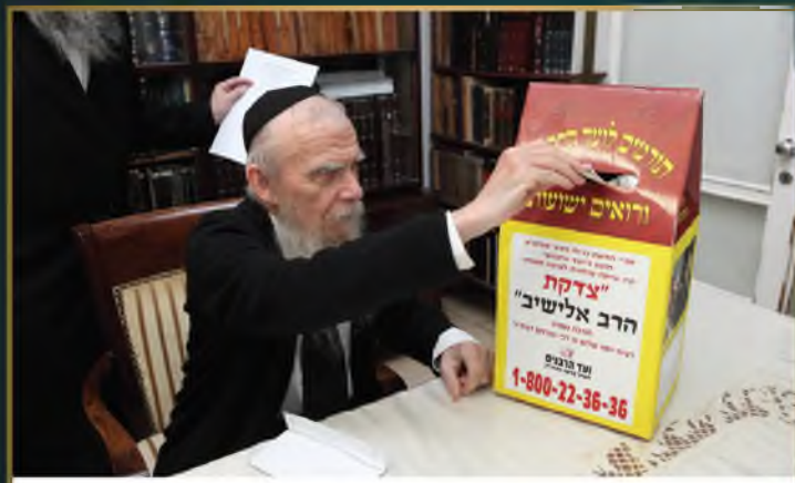
מרן ראש הישיבה זצוק"ל מקים ב"ועד הרבנים" את קרן צדקת הרב אלישיב