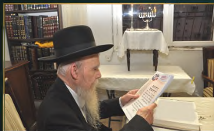
מרן ראש הישיבה זצוק"ל מתפלל על תורמי "ועד הרבנים" בהדלקת נר חנוכה תשע"ב