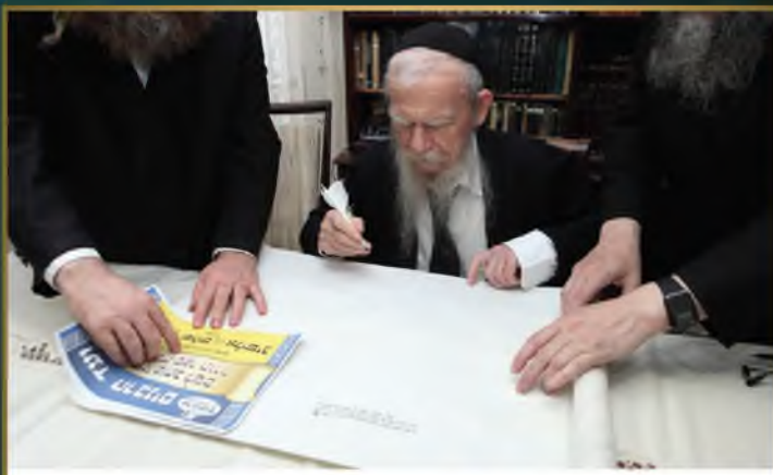
מרן ראש הישיבה זצוק"ל בתחילת כתיבת ספר תורה לע"נ מרן הגר"ש אלישיב זצוק"ל