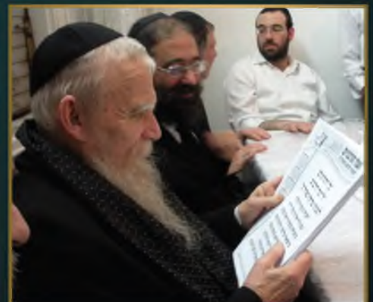
מרן ראש הישיבה זצוק"ל בסעודת פורים תשע"ג