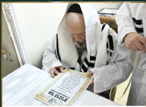
מרן ראש הישיבה זצוק"ל מעתיר על תורמי ועד הרבנים ערב יום כיפור תשפ"ג