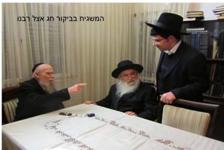
המשגיח בביקור חג אצל רבנו

בעיקר המשגיח זירז את הרב כהן לרכז את השיחות ודברי ההדרכה של רבנו בספר מכורך, ואמר לרב כהן שלא ימתין להוציא לאור רק כשהיה ספר מושלם, אלא קודם כל שיוציא מה שיש, וכפי שכותב חובות הלבבות מן הזהירות שלא תרבה להיזהר, וחובות הלבבות בעצמו כותב בהקדמה שמיהר להוציא את ספרו אע"פ שלא השלים חפצו בשביל שחשש שאם לא ימהר לא יוציא עי"ש. ומעיד הרב כהן שהעובדה שניגש אל המלאכה והתמסר כ"כ להזדרז להוציא ספרי דרכי החיזוק זה אודות לזירוזו ותמיכתו הנלהבת של המשגיח. גם את הקובץ לאורם על מועדי השנה שהוציאו מדברי רבנו (יחד עם