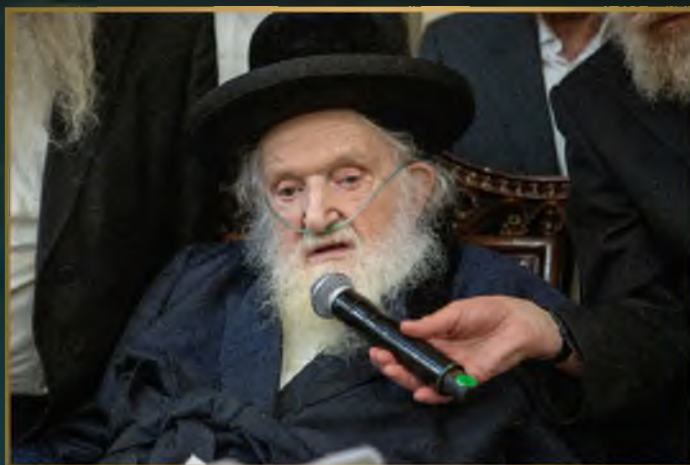
הכנסת ספר תורה בריסק