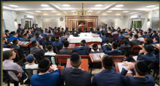
מרן הגרמו"צ בדרגמן שליט"א חבר מועצת על חשיבות הפעילות של מוקד העירוב