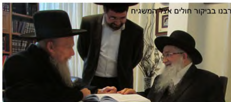
רבנו בביקור חולים אצל המשגיח