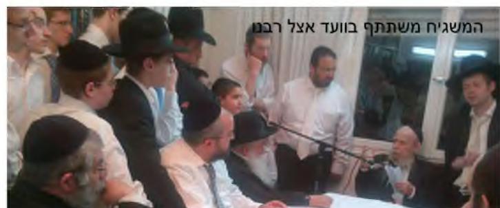
המשגיח משתתף בוועד אצל רבנו

היה פעם שהיה חוסר תיאום והמשגיח הגיע בטעות לביקור חג באמצע שרבנו מסר וועד, המשגיח שמח על ההזדמנות לשמוע דברי מוסר מרבנו וישב כאחד התלמידים ושמע בשקיקה את דברי ר' גרשון. רבנו לא חש בנח שהמשגיח יישב לשמוע אותו, ופנה למשגיח ואמר 'אני מטריח אתכם לשמוע...' המשגיח השיב 'אני מאד מאושר לשמוע את דברכם'. אחר כך רבנו ביקש מהמשגיח שיאמר דברי חיזוק לבחורים, 'הבחורים רוצים לשמוע עוד, זה דבר נדיר שהרב יגיע הנה', והביא גמרא בחגיגה על ההוא סבא שאף פעם לא הגיע לבית המדרש ופתאום הגיע לבית המדרש, ואמרו שזהו סימן שמשוהו מן השמים רוצים לשמוע ממנו, ואמר רבנו למשגיח: רוצים לשמוע גם הני מילי מעלייתא", והמשגיח הוסיף כמה מילים בהקשר לדברים שאמר רבנו.