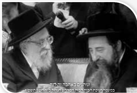
ונותנים באהבת זה לזה במעמד תפילת הבית לבית המדרש הגדול ב"חידושי תוס'"

בנוסף לכך ידוע על הרה"ק ר' שלמה מזוועהיל זי"ע שרבינו התבונן בו ארוכות, ועל הרה"ק ר' ישראל מהוסיאטין זי"ע, ועוד הרבה מצדיקי בית טשערנאביל וריזין, שרבינו רחש לכו לקנות מכל אחד ואחד הנהגות ושמועות טובות, וכל ימיו היה מספר בערגה עובדין קדישין ממה שראה וחזה במחיצתם. גם אחר נישואיו שיחרר לפתחם של צדיקי ארה"ב הרה"ק ר' מרדכי שלמה מבאיאן זי"ע והרה"ק ר'