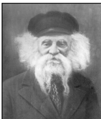
הרוגוטשובער: "הוא כופר בהשגחה העליונה"