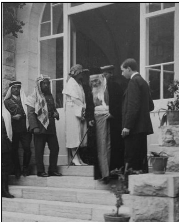
רבי יוסף חיים זוננפלד מרא דארעא דישראל

פתיחתה של האוניברסיטה בירושלים היה לדידם יום חג, יום של נצחון אשר הם מצליחים לתקוע יתד להקים מרכז ”השכלה” בתוככי עיר הקודש והמקדש, לכן יום זה היה לדידם יום חג, יום של ניצחון רח”ל, יום בו הם רואים כיצד ”חזונם” הולך ומתגשם, תוכנית ההרס והחורבן קורמת עור וגידים.