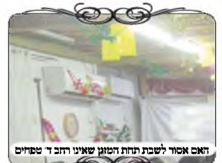
רוחב אסור לשבת תחת המזגן שאינו רחוב ד' טפחים