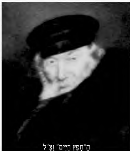
ה"חפץ חיים" וצ"ל

בינתיים האיר הבקר, אה הנוסעים נותרו רדומים. בעונה זו של השנה שעות האור הן מועטות, כך יצא שהנוסעים שימשו חזק במשך יותר משתים עשרה שעות, והתעוררו כאשר שוב החשך היום. אמרו