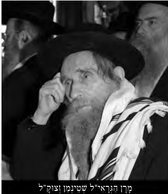
מרן הגר"א"ל שטיינמן וצוק"ל

האפשרות לעשות זאת. באותו יום שהכריזו אחינו שונאינו ומנדינו בערכאותיהם שאין בארץ ישראל זכות לכל מי שחפץ להקדיש עצמו לתורת ה' ועבודתו לעשות זאת - אבד חלק גדול מזכות התורה והגנתה. כשנאבדת הגנה זו - הננו נמצאים רח"ל בסכנה הגדולה ביותר שיכולה להיות! עד כאן דבריו. מלח הנחה זו, הורה רבנו וצוק"ל בעצם ימי המלחמה לאחד הר"מים החשובים שהיה צריה לנסע למסור שעורים בישיבה חשוכה בדרום, במסגרת תפקידו לחזק ולרומם את בני הישיבה. הוא שאל את רבנו אם מתר לו לנסע לשם, ונענה בזה הלשון: "הערבים מפחדים ממה, אתה יכול לנסע".