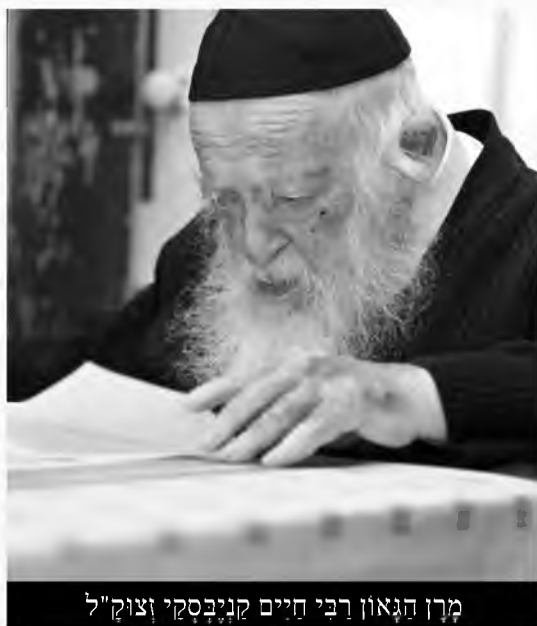
מרן הגאון רבי חיים קניבסקי זצוק"ל

אלו היה הקב"ה פוקח את עינינו, כפי שנפקחו עיני הנער, היינו רואים כי העיר בני ברק וכל מרכזי התורה מקפים במלאכי אש ובחומות בצורות וחזקות! ומה הן החומות הללו? מיליוני המשניות ומאות אלפי דפי הגמרא שנלמדו בבתי המדרש ובשיבות שבבני ברק – הם הם שימנעו בעד הסקאדים מלהכנס לעיר, הם כדגמת צבאו של אלישע. זה כחה של תורה! בזכות לומדי התורה נצל המקום כלו.