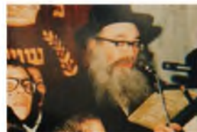
רבי ניסים קרליץ