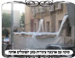
סוכה עם ארבעה צינורות פזון הפוסלים אותה

עם תחילת זמן חורף, נפתחת ההרשמה ללימוד המיוחד של הלכות עירובין למעשה, עם סידרת השיעורים והמצאות המחמישים את ההלכות המורכבות בצורה פשוטה וברורה. להרשמה ניתן לפנות למוקד הטלפוני של מוקד העירוב - 0548483320, שלוחה 6. או בטל' ההרשמה 0556783323.