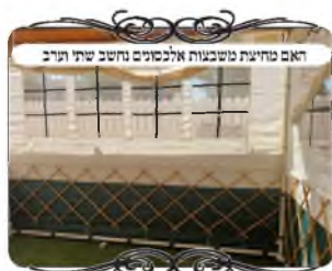
האם מחיצת חשבונות אלכסונים נחשב שתי וערב

בענין זה נביא שאלה שהגיעה בשנה זו למוקד העירוב בקו הסוכות, על סוג חדש של מחיצה, שמשמשים בה בסוכות מבד [שהבד פסול מפני שמתנדנד ברוח], ויש בה קנים מחוברים בצורה שיכולה להתקפל, וכשפותחים אותם נוצר חורים כמו