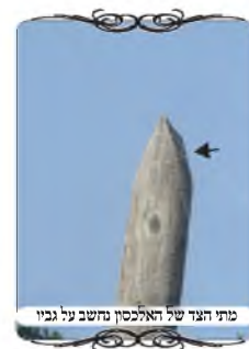
חומת הקושי לטווחי תאורה סודית

והנה בחז"א (סי' ע"א ס"ק י"ב) עמד על צורות שונות של ראשי העמודים, וכתב שאם יש עמוד כעין חרוט, שמתחילתו עד סופו הוא