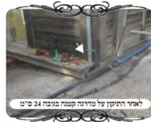
לאחר התיקון על מדרגה קטנה בגובה 24 ס"מ

במקום העמוד הזה, היתה עדיין בעיה הלכתית, שנפתרה על ידי חישוב מדויק. לפני המבנה שאליו מוצמד העמוד, יש מדרגה קטנה שגם היא מעץ, ויוצא שהעמוד חייב להיות על המדרגה. אבל בחז"א (סי' ע' ס"ק י"ח) מבואר שהעמוד צריך להתחיל תוך ג' טפחים לקרקע, ואפילו אם אין חלל מתחתיו כגון שהוא יושב על מדרגה, אם היא גבוהה ג' טפחים, הרי העמוד נחשב למחיצה תלויה ואינו כשר, אלא אם יש על המדרגה שטח בשיעור קרקע בפנ"ע, דהיינו ד' על ד' טפחים. מדדנו את גובה המדרגה, והנה היא 24 ס"מ, כלומר שהיא גבוהה ג' טפחים לשיעור רח"נ התחבטנו מה לעשות, כיון שאם נעביר את העמוד לקרקע שלפני המדרגה, יצטרכו להביא עמוד אחר יותר חזק מאשר זה שצמוד לקיר, וגם יהיה רווח בין העמוד למבנה, בקיצור זה יהיה הרבה יותר מסובך. מדדנו את רוחב המדרגה, והנה היא