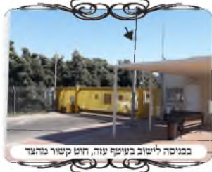
בבנייה ליישוב בנעם עזה, חוט קשור מזהב

ביום שמחת תורה שבו פרצה המלחמה, בעיר בית שמש בשכונת רמה ד', ברחוב חנו פינת מר עוקבא, סמוך למתחם שיש בו חמשה בתי כנסת עם מאות מתפללים, נפל טיל שלא יורט בכיפת הברזל, הטיל פער חור עמוק באדמה, ובחסידי שמים לא נגרם נזק סביב. כאשר פינו את הטיל, ראו שהוא ללא ראש נפץ, חבלני המשטרה חפרו עמוק כשני מטרים ולא מצאו, והבינו שכנראה קרה משהו מוזר, ומשום מה הוא נפל באמצע הדרך. תושבי השכונה הרגישו את הנס הגדול שהיה איתם, ושמו בטחונם בה'.