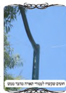
חומת הקושי לטווחי תאורה סודית

בית כנסת פרטי, ומזמינים לשם בחורים מידי שבת כדי שישלימו להם מנין. באותו מתחם עשו עירוב לפני כמה שנים, וכעת אחד מהשותפים קרא לנו לבדוק אותו. כשהגענו גילינו לצערינו שהיו טעויות כבר בהתקנתו, בקטע מסוים קשרו חוטים לעמודי תאורה מהצד ממש, שכל מי שמבין מהו עירוב יודע שאי אפשר לעשות כך. וגם מעט דברים שהתקלקלו במשך השנים. בעלי המקום ביקשו מיד שנעשה את התיקונים, אך בשלב זה הצלחנו לתקן רק מתחם אחד משטח העירוב, מכיון שבחצי השני צריך להמציא תשתית חדשה ממש, שהיא בעייתית מצד התושבים.