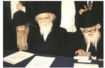
מרן עם הגרא"מ שך והגרי"ש אלישיב

כשהקים מרן הרב שך זצ"ל את תנועת "דגל התורה", הוא עירב את מרן שליט"א בסוד העניינים ושלא לעדכן אותו בכל הפרטים הנדרשים, כשהוא מצידו מבקש את הצטרפותו של מרן שליט"א, לתומכי התנועה ולשמש כחבר מועצת גדולי התורה שתדריך ותכוון את דרכה של המפלגה. הערכתו כלפי מרן שליט"א – הייתה מן המפורסמות, עוד מנערותו בבריסק.