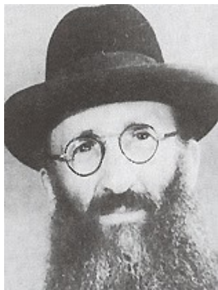
הגר"א אליעזר דסלר

לאחר מכן, היה מזכיר מרן שליט"א בערגה ובזיכרון מופלא - דרשה אחת ששמע אז מהמשגיח על הפסוק המובא בהפטרה של בלק 'הגיד לך אדם מה טוב', וחזר על כל הדרשה מילה במילה בפרוטרוט! כאילו שמע זאת אתמול... את יחס הערכתו כלפי שיחותיו של הרב דסלר התבטא מרן שליט"א, ש'יתכן ואולי רק הגר"ש רוזובסקי ירד לסוף דעתו...".