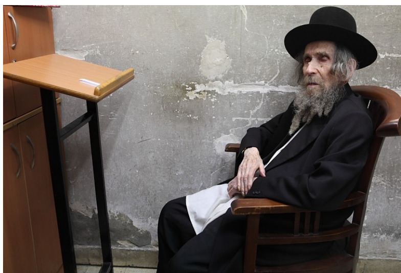
מאחור נראים קירות הבית הבלתי צבועים

כאשר ביקר האדמו"ר בעל ה"ישועות משה" מויז'ניץ זצ"ל בבית יבדלח"ט מרן שליט"א, והושיבו אותו הכסא שיש בבית, התפעל מאד, ואמר: "כסאות אלו מזכירים לי את בית זקני הרה"ק בעל ה"אהבת ישראל" מויז'ניץ זצ"ל, וכי מאז עוד לא הזדמן לו לשבת על כסאות פשוטים כאלו".