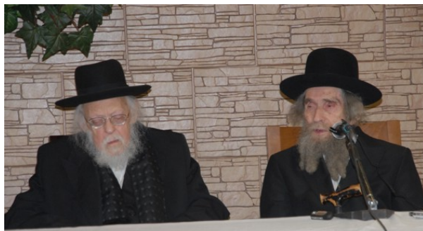
עם מרן הגרי"ש אלישיב זצ"ל

סיפור מופלא המעיד כאלף עדים על הערכתו המופלאה של מרן הגרי"ש זצ"ל אל יבדלחט"א מרן שליט"א, מספר מקורבו של מרן זצ"ל - הגרא"מ קרביץ שליט"א (בספר 'השקדן' ח"ג): פעם הזדמן הרב קרביץ - מי שזכה במשך שנים רבות להיות ה"חתן בראשית" במניינו של מרן הגרי"ש זצ"ל - לביתו של מרן שליט"א, והתבטא לפניו איזה חוכא וטלולא זה להיות חתן בראשית ליד מרן הגרי"ש - שהוא עצמו מקבל "חתן תורה". אמר לו מרן