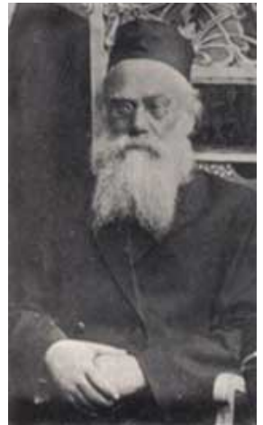
הגר"ש שקאפ זצ"ל