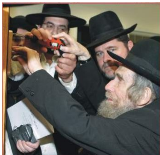
מרן בקביעת מזוזה

מעשה היה בתלמיד חכם, שביום הפורים בהשכמה הביא למרן שליט"א חמשת אלפי דולר במיוחד בכדי להעביר לאברך שמתבייש לקחת כסף, ולא ייקח רק אם מרן שליט"א ישלח לו אישית. לאחר כמה שעות הודיעו למי שהביא את הכסף, כי מרן שליט"א שרוי בצער רב כי הכסף נעלם, וכי כבר זמן רב שמחפש את הכסף בביתו (בעיצומו של יום הפורים), וכנראה נגנב. ביום שושן פורים קרא רבינו לאותו תלמיד חכם. ואמר לו: "מעיקר הדין כיון שלא היה עלי דין שומר, אלא שליח להעביר את הכסף איני חייב בגניבתו, וכך היא ההלכה. אבל הרי אני עוד מעט אבוא לעולם האמת וישאלו אותי (לענין דין שמים), עד כמה הייתי אחראי, ושמא תהיה עלי שם איזו תביעה, לכן אשלם את כל הכסף". והמשיך מרן שליט"א לומר: "בינתיים, ביום הפורים עצמו כבר נתתי לאותו אברך