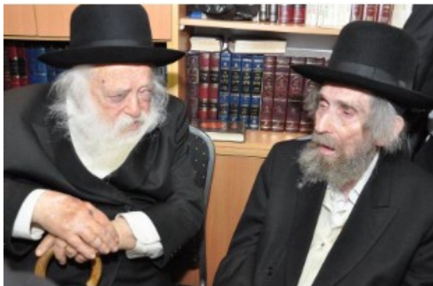
מרן עם בנו של הסטייפלר הגר"ח קנייבסקי שליט"א

מתוך רוב הערכה והקשר שהיה למרן שליט"א עם החזו"א זצ"ל זכה בנוסף כבר אז להיכרות קרובה עם גיסו הסטייפלר זצ"ל (לימים מחותנו), שהרבה לומר כי "רבי אהרן ליב הוא אדם גדול". היה מרבה להפנות אנשים הזקוקים לעצה וברכה ובכמה עניינים ציבוריים אל מרן שליט"א – אף בהיותו צעיר לימים.