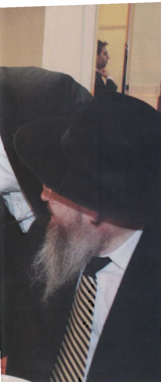
רגעים מאירים. כותב השורות בצילו של מרן הגר"מ זצ"ל