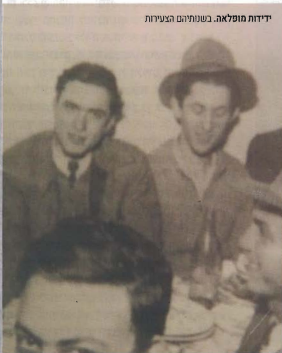
ידידות מופלאה. בשנותיהם הצעירות

"ידיד יקר ונאמן", כך סיים הגר"ד את ההספד המרגש, "רבות פעלת בחיך, והנך הולך לבית עולמן בתורתך ובמעשיך הנשגבים. ותהא נשמתך צרורה בצרור החיים, והשם ישלח תנחומים למשפחה הנעלה, לצאצאיו, ולאחיו, וכל הנלוים עליהם, תלמידיו ומושפעי ושומעיו לקחו ומוסרו, ידידיו ומוקיריו, ובילע המוות לנצח ומחה ד' אלקים דמעה מעל כל פנים".