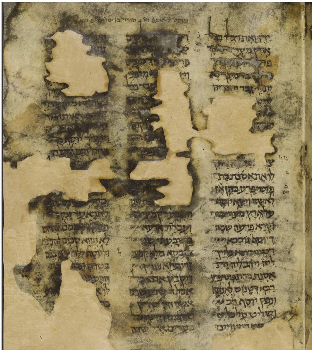
Oxford Bodleian Ms. Heb. b 17, folio 6(r)

אזכיר לטובה את ספריית אוקספורד, מנהליה ועובדיה, שבזכות פועלם בהנגשת קטעי הגניזה מצאתי את הקטעים החדשים, תודה להם גם על תצלום הדף ועל הרשות לפרסמו. ייזכר לטובה גם פרויקט הגניזה שע"י אגודת פרידברג שנעזרתי בו הרבה.