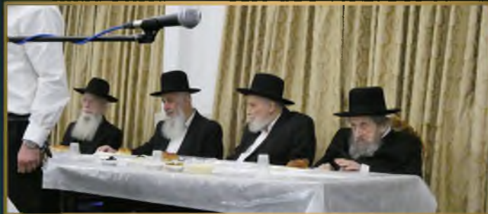
מרן ראש הישיבה הגדמ"ה פוברסקי שליט"א