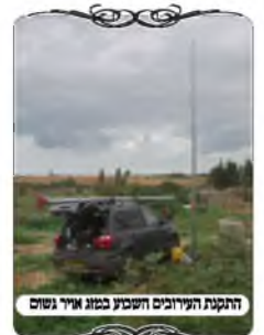
התקנת העירובים החדשים במזג אוויר גשום

במקרה זה הלחי היה מקרש, שקשור עם חוט ברזל לעמוד החשמל. והנה יש שתי צורות לקשור, יש אפשרות לעשות חורים בלחי בהתאם