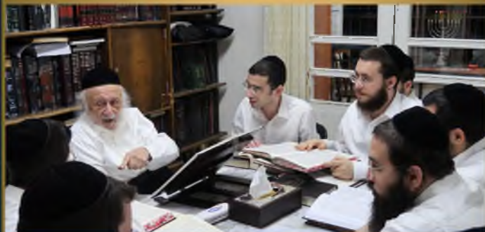
בחבורה לקבוצה מבני הקיבוץ