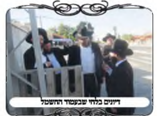
דיונים בלחי שבקשור החשמל