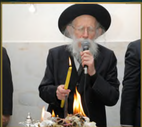
מרן הגה"צ רבי שמעון גלאי בשדיופת הפתילות בת"ת שמחת התורה ב"ב