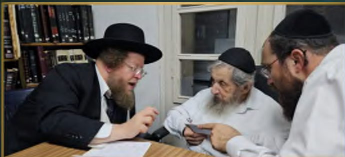
ראש ישיבת עטרת שלמה הגדמ"ה סודוצקין מתברך לפני נסיעתו לטובת הישיבה