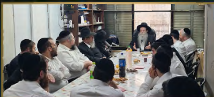
דברי הדרכה לחינוך הילדים מראש הישיבה הגר"ש קניבסקי שליט"א שנמסרו בביתו לאברכי כולל "זאת ליעקב" שע"י ישיבת קרית מלך