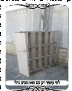
לחי קשור קר עם חוט סביב סול