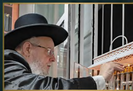
הגאון הגדול רבי יהושע ברכין שליט"א