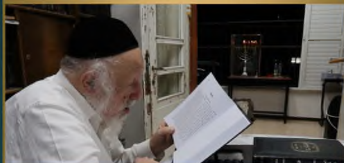
אודה זו תורה שוקד על תורתו בחנוכה