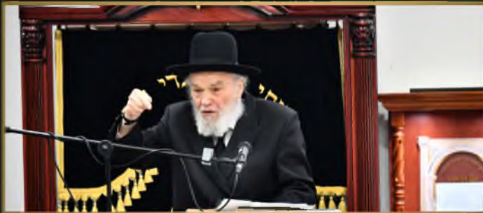
רבינו מרן ראש הישיבה הגדמ"ה הירש שליט"א במושא המרכזי בקהילת "בית השם" בבני ברק במוצ"ש מקץ בהשתתפות אלפים