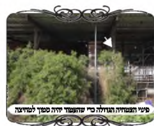
פיני הצמחיה המדולה ב"ר שהנפוח היה סמוך לחציצה

כמה שנים טובות, והצמח במשך הזמן מסתבר שיגזמו אותו וישאר פירצה.