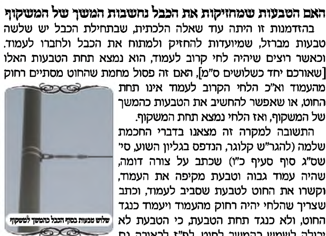
שלוש טבעות בסוף הכבל כדומות למשקוף

האם הטבעות שמחזיקות את הכבל נחשבות המשך של המשקוף בהדמנות זו היתה עוד שאלה הלכתית, שבתחילת הכבל יש שלשה טבעות מברזל, שמיועדות להחזיק ולמתוח את הכבל ולחברו לעמוד. וכאשר רוצים שיהיה לחי קרוב לעמוד, הוא נמצא תחת הטבעות האלו [שאוורם יחד כשלושים ס"מ]. האם זה פסול מחמת שהחוט מסתיים רחוק מהעמוד וא"כ הלחי הקרוב לעמוד אינו תחת החוט, או שאפשר להחשיב את הטבעות כהמשך של המשקוף, ואז הלחי נמצא תחת המשקוף. התשובה למקרה זה מצאנו בדברי החכמת שלמה (להגר"ש קלוגר, הנדפס בגליון השוע, סי' שס"ג סוף סעיף כ"ו) שכתב על צורה דומה, שהיה עמוד גבוה וטבעת מקיפה את העמוד, וקשרו את החוט לטבעת שסביב לעמוד, וכתב שצריך שהלחי יהיה רחוק מהעמוד ויעמוד כנגד החוט, ולא כנגד תחת הטבעת, כי הטבעת לא יכולה לשמש כהמשך לחוט. לפ"ז לכאורה גם במקרה שלנו, הטבעות אינם יכולים לשמש המשך לחוט. אך יש מקום לדול לחלק, שבמקרה של החכמת שלמה מדובר בטבעת רחבה שאינה ממשיכה בקו של החוט, אל מתרחבת ופונה מסביב לעמוד, משא"כ במקרה שלנו מדובר בטבעות קטנות שממשיכות בקו של הכבל. מ"מ עדיין מדובר בצורה של טבעת, ואין זה קו ישר של החוט. ולכן אם רוצים שיהיה לחי תחת הכבל, צריך שהלחי יהיה רחוק מהעמוד כשלושים ס"מ, כדי שיהיה תחת החוט, ולא תחת הטבעות.