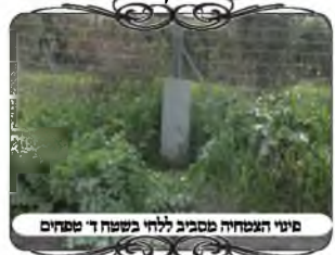
פיני הצמחיה מסביב לחי בשטח ד' טפחים

בתקופה זו החלה הצמיחה שבאה אחרי הגשמים, וכשהגענו ראינו רק חצי לחי, כי החצי התחתון היה מוסתר בצמחים. דין זה דומה קצת למקרה הקודם של חבית שהצטבר חול מסביבה, שהחול ממעט את גובה החבית, ולכאורה הוא הדין כאשר הצמחים מכסים את פני האדמה. אלא שיש להבדיל ביניהם, כיון שהצמחים רכים, אינם יוצרים קרקע, ואף אם אינם מתנדנדים ברוח, מ"מ קרקע צריכה להיות חזקה וראויה לשימוש. ובהגדרה זו י"א שצריך שיוכלו לעמוד על הצמחים והם לא יתמעכו, וי"א שראוי להניח עליהם דברים [כ"מ בגמ' מנח מידי ומשתמש].