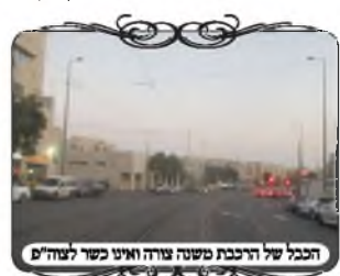
הכבל של הרכבת פסגה צורה ואינו כשר לעירוב

השתמשות בכבל חשמל דורשת שימת לב מיוחדת שיהיה כשר בשבוע זה נתבקשנו מאחת השכונות בירושלים למצוא פתרון לעשות עירוב במקום שעוברת הרכבת הקלה. דבר זה הוא בעייתי מאוד, כיון שלא נותנים רשות להעביר חוט מעליה. לפני כמה שנים היתה בעיה זו גם לעירוב הכללי של הבד"ץ, באזור הגבעה הצרפתית במקום שעובר קו העירוב, נאלצו להשתמש בכבל החשמל של הרכבת שישמש את העירוב, למרות שהוא לא כ"כ ישר. עד שלאחר כמה שנים הגיעו להסדר עם הנהלת הרכבת להעביר חוט ישר. גם במקרה זה הם רצו להסתמך על כבל החשמל של הרכבת, אחד מהכבלים שחוצים לרוחב המסילות והכביש, ושאלו באיזה כבל שייך להשתמש בדקנו את הכבלים, אך לצערנו אף אחד לא היה כשר. והיה להם כמה צורות היה כבלים שהיו מורכבים משני זוויות שונות ואינם קו רציף מצד לצד, שזה אינו כשר כלל. היו כבלים שחצו מצד לצד, אך היו מחוברים להם כבלים לאורך באופן שהזווית אותם לצד בצורה משמעותית מאוד. מתוך קטע ארוך שברחוב, היה רק כבל אחד שהיה נראה מקרוב שהוא די ישר, אך לפעמים מקרוב קשה להבחין בצורה הנכונה של הכבל, לכן עמדנו בצד, וראינו שהצרה שלו משתנית מאוד, ואינו יכול לשמש לצורת הפתח. האברך שביקש לעשות את העירוב היה מאוכזב מאוד, ושאל האם לעשות בכל זאת עירוב כזה. אמרנו לו שבאזור שהוא נמצא שאין עירוב פנימי כלל, מסתבר שיש עדיפות לעשות את העירוב גם כך, אבל לא יהיה ניתן להכשיר ולומר שאפשר לטלטל בו, כיון שההוראה היא שצריך להחזיר את החוט ישר, וללא שוקע ונוטה בצורה כזאת. מדבר זה למדנו, שצריך לבדוק כל מקרה לגופו, ולהתבונן אם הוא עומד בגדלי ההלכה. לא שייך ללמוד ממקרה אחד שהשתמשו בכבל החשמל למקום אחר, כיון שיש לפעמים שינויים שלא שמים לב אליהם, אבל ע"פ הלכה יש בהם משמעות גדולה.