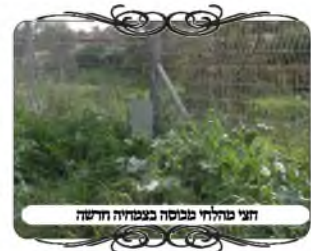
חצי פתחור פסיכה בצמודה לדירה

במקום אחר נפגשנו עם עמוד שהיה מאחורי גדר, והגדר היתה חלק ממחיצות העירוב, שא"כ העמוד שמאחורי הגדר הוא מחוץ לעירוב, ואינו כשר ע"פ מש"כ המשגיב (סי' שס"ג ס"ק ק"א) שעמוד בחצר אחרת אינו כשר [ויש להאריך בזה מדוע יש לדמות לעמוד מוקף מד' רוחות]. כדי להכשיר את העירוב, העמידו קרש וחברו אותו לפני הגדר שישמש לחי, ועי"ז אין צורך להתחשב בעמוד שנמצא מעבר לגדר.