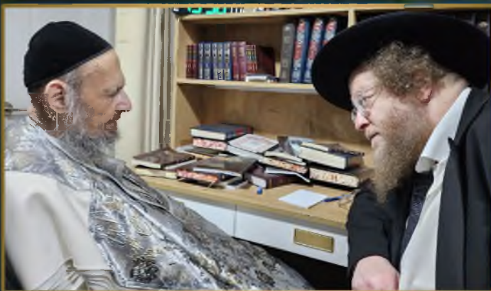
ראש ישיבת 'עמדת שלמה' הגרמ"צ סודוצקין אצל הצדיק הגאון רבי דב קוק שליט"א בטבריה