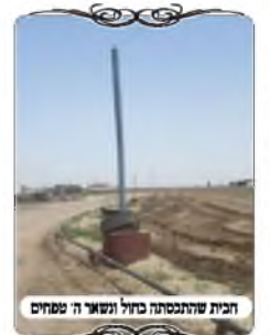
חבית שהתכנסה בחול ונשארה שפוחית

כמו כן לפעמים העמוד נמצא בתוך החבית אבל הוא עומד עקום מעט, ואפילו שאינו עקום הרבה מצוי שעד גובה החוט יוצא שהוא נוטה כמעט