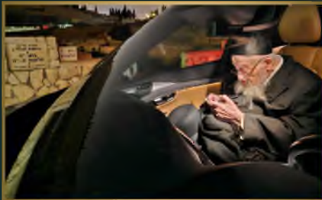
על קבר א"ה ע"ה בחר המנוחות