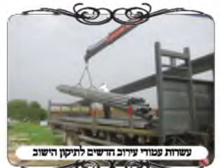
עשרות עמודי עירוב חדשים לתיקון הישוב

כאשר יש קו חשמל מהצד של עמודי החשמל, ומעמידים חביות תחת הכבלים כדי שהכבלים יהיו חוטי העירוב [והמעלה שלהם, שהם חזקים וארוכים], צריך להעמיד חביות ליד העמודים, כדי שהם יהיו הלחיים. וצריך בכל מקום שתי חביות, כי לכל עמוד מתחברים שתי צורות פתח, אחת בחוט שמגיע לעמוד, וזו חבית ראשונה. וצוה"פ השניה בחוט שיוצא מהעמוד הלאה, וזה צריך עוד חבית [או לחי], כי החבית שמונחת בצד הראשון, אינה תחת החוט שיוצא לצד השני. אמנם בעמוד רגיל שהחוט מונח עליו, עמוד אחד משמש לשני הצדדים, כי שני החוטים יושבים מעליו, משא"כ בחבית שמוסיפים לעמודי חשמל, שהיא בדרך כלל בצד אחד של העמוד, אינה יכולה להועיל לשני הצדדים, אלא צריך שתי חביות.