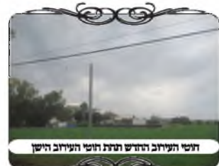
חוט העירוב החדש תחת חוט העירוב הישן

במקום נוסף שהוספנו עמודים חדשים במקום הקו הישן, פגשנו בהלכה נוספת, שמלמדת כמה חשוב להיות מחושב עם כל ההלכות, ולא רק להעמיד עמודים וחוט. באחד מהרחובות היה צריך לחדש ארבעה עמודי עירוב, מחמת שהעמודים הישנים היו בין ענפי העצים. הקו החדש של חוטי העירוב, ער מתחת הקו הישן, וחצה אותו ימינה ושמאלה, כדי לתמוך בין העצים. לאחר יציקת העמודים, וקשירת החוטים, שמנו לב שהחוטים עוברים זה על זה, ויש בזה בעיה הלכתית.