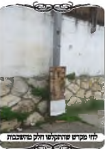
לחי מקושר שהתקלה חלק שהשכבות

בסמוך לשכונה שנעשה הסיור הנ"ל, התעוררה שאלה הלכתית בעירוב של אברך שגר ברחוב הסמוך, ורצה להרחיב את העירוב של השכונה עד ביתו. אך לא היה לו את התמיכה והאמצעים להשקיע כפי שמשקיעים היום בעירובים הטובים, הנעשים עם עמודי ברזל תקינים ולחיים מברזל מגלון (כסוף וחלק), אלא הוא עשה באמצעות קשירת חוטים לדברים קיימים, למרפסת של שכן, ולשער של מתחם אחר, והעמיד קרשים שיהיו לחיים. באחד מהקרשים שהיה עשוי מחתיכת דופן של ארון, עץ סנדביץ מצופה פורמיקה, עברו חודשים והגיע גשם ושמם ופוררו את השכבות, הפורמיקה נפלה מרובו ונשאר חלק קטן, וגם השכבות האחרות נחסרו. כעת שואל האברך האם דבר כזה נחשב "פתחי שימאי" שיש שיטות שאינו כשר לחי של צורת הפתח. מצאנו בשער הציון (סי' שס"ג ס"ק י"ט)