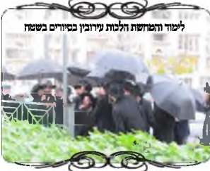
לימוד והמושת הלכות עירובין בסיוור בשטח

בשבוע זה המשכנו עם הסיורים בעירובים ללומדי השיעורים, השבוע התקיים הסיור בירושלים, בהשתתפות עשרות אברכים, ועברנו על היקף של אחת השכונות, למדנו והחכמנו מכל הפתרונות שעשו, ומה שתיקנו. כמו כן היה מקום שהעובד עשה תיקון והוא לא היה טוב, ואחריו הוסיפו תיקון חוזר עם קרש כדי להשלים את החסר. הדברים האלו לימדו אותנו, שגם בעירוב טוב יש צורך בהרבה השקעה, ולא תמיד התיקון נעשה כהלכה. לפעמים צריך אח"כ לחזור ולתקן שוב, וכן להוסיף בשלבים הבאים בהידור של העירוב. ולא יוצאים די חובה בפעם אחת לתמיד, אלא יש להמשיך ולהוסיף, ולציבור היקר להבין שנדרש ג"כ להוסיף ולתמוך בעוסקים תמיד.