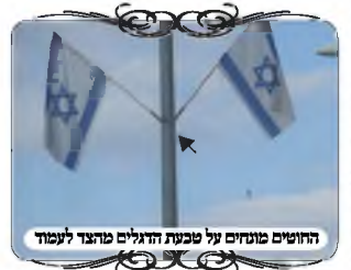
החוטים מונחים על טבעת הדגלים מוצדק לעמוד

הגענו לצד חדש של העיר, עם תקווה שעכשיו יהיה טוב. בצד הזה יש רוב גדרות של גדר הנמצאת על אי תנועה שבכביש המהיר לכל אורך העיר, ובצמתים עשו צורות הפתח. במקומות אלו היתה צורה אחידה של יותר מעשרה צמתים, שקשרו את החוטים לעמודי תאורה גבוהים, ומקום הנחת החוט הוא שוב בטבעת של הדגלים, שכאמור זה מהצד של העמוד, אלא שבעמודים האלה לא היתה התרחבות כמו בעמודים הידוקים. זאת אומרת שהם אינם כשרים לגמרי. [גם השיטה שמתחשבת בהתרחבות באלכסון, לא הועילה כאן, כי העמודים היו כמעט ישרים, והחוטים שבטבעת הדגלים אינם צמודים ממש לעמוד].