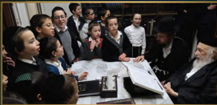
תלמידי ת"ת אור זרחה במבחן אצל מו"ן ראש הישיבה שליט"א