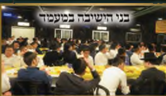
בני הישיבה במעמד