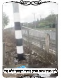
לחי בגדר וחוט מניח לצדי העמוד ללא לחי