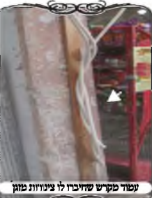
עמוד מקושר שהיכירו לו צינורות מוזן

במקום נוסף עשה צורת הפתח קטנה עם עמוד עץ לייסר רחב כעשרה ס"מ, והצמיד אותו לקיר הבנין. כעת הוא הבחין שמישהו ניצל את הקרש