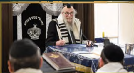
מעמד סיום חפץ חיים בישיבת מגדל עוז