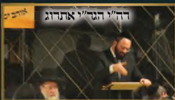
רה"י הגר"י אהרונג