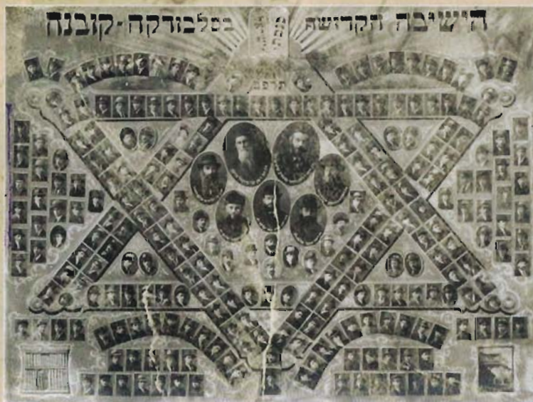
עידית שבבידית. תמונת מחזור של ישיבת כנסת ישראל - סלבודקה

אירופה של אותן שנים סיפקה לא מעט דמויות של נשמות-מיוסרות, נאונים שלא מצאו מזור לנפשם. אנשים שהרגישו שתהפוכות העולם, הקדמה והמורדנה לא הצעידו את האנושות קדימה