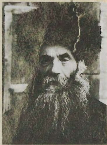
"הורגלנו לראות גאונים". הגאון רבי איסר זלמן מלצר זצ"ל