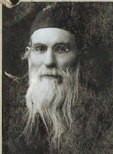
קרבא מיוחדת. הגאון רבי נתן צבי פינקל, היסבא' מסלבודקא זצ"ל