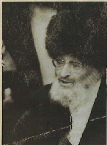
החניך. הגאון רבי יצחק הוטנר זצ"ל

בסלבודקה הוא גילה עולם אחד, חדש. עולם שבו העבודה לא הייתה מכוססת על החרדה הקיומית מפני המוות והולך וקרב - אלא מכוחם של החיים המפכים שחנן בהם ד' את ברואי