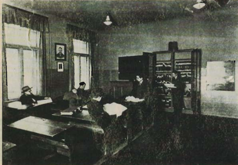
שיעור של ברלין יכול להימסר בטלז. בית המדרש לרבנים בברלין

"מבין אני לרעך... יודע אני מה אתה צריך לחשוב עתה", אמר לו הסבא. "תמה אתה על כל אותם הדברים שעומדים ברומו של עולם, כל אותם השאיפות והמגמות והרצונות שעל ידם הולכים ונגרים נחלי