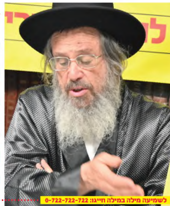
לשמיעה מילה במילה חייגו: 0-722-722-722

"ומי שיסייע יותר מכפי יכלתו בוודאי ובוודאי יזכה"