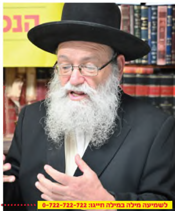
לשמיעה מילה במילה חייגו: 0-722-722-722

"אנחנו מבקשים מהציבור... הצדקה הזו היא צדקה הכי מעולה"