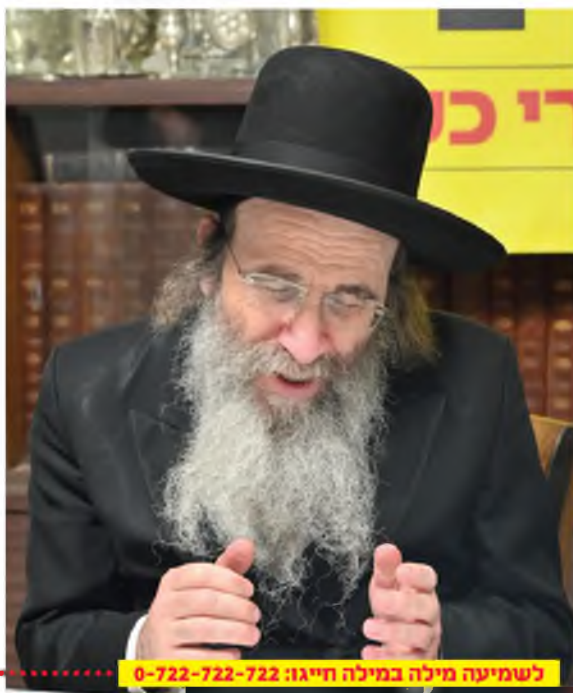
לשמיעה מילה במילה חייגו: 0-722-722-722

"אבל אדם שקצת מתאמץ יותר אז גם יתנו לו יותר ממה שמגיע לו"