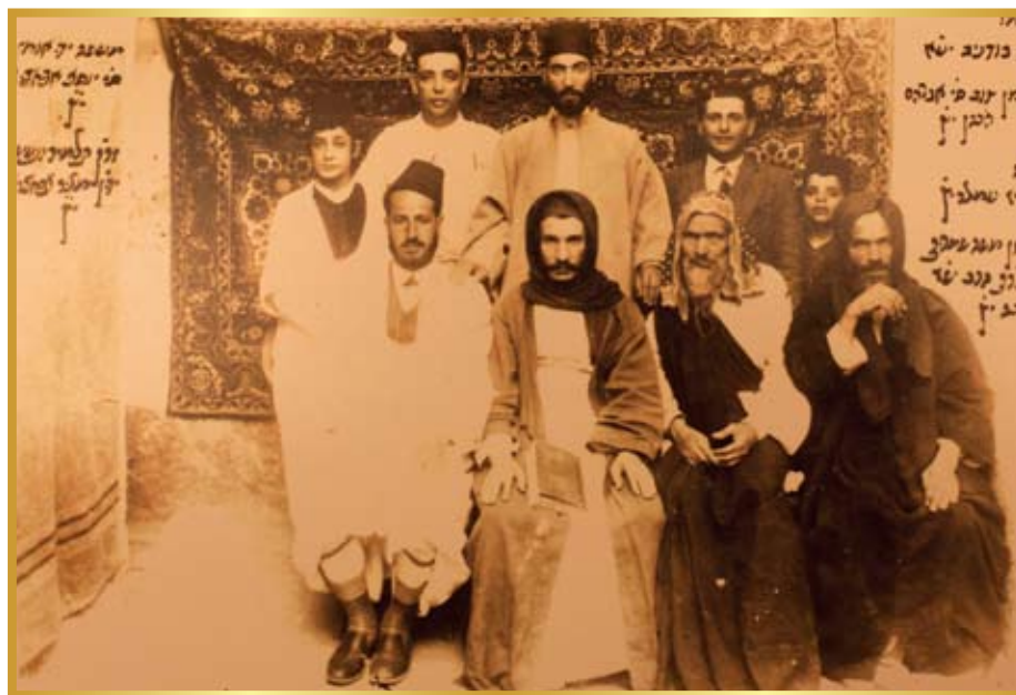
בבא סאלי זיע"א בצעירותו (במרכז התמונה)

ראינו בחוש שהוא נמצא במדרגות שאין אנו מבינים ומשיגים כלל. לא פעם ראינו שהוא יודע גם מה שלא היה לנגד עיניו, ואם היה מי שניסה להסתיר ממנו משהו, היה מראה לנו ברמז או בפירוש שהוא כבר יודע הכול, ואין מה לנסות להסתיר ממנו. גם כשהיינו מתלחשים בינינו בקצה השני של הבית, כשהיינו באים לפניו היינו רואים שהוא כבר יודע הכול. פעם אחת, כשישב עמנו בשולחן, הצביע לי על כלי מסוים ואמר לי: "קח מכאן את הכלי הזה, הוא לא טבול". מיד שאלתי את מרת אמי, איך יתכן שיש כאן כלי שאינו טבול? אמרה לי אמי, שכלי זה הוא מפלסטיק, ומעיקר הדין אין הוא צריך טבילה, אבל הוא החמיר והקפיד להטביל אף כלי פלסטיק, ובעיני קודשו ראה כי כלי זה אינו טבול.