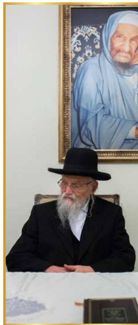
"הושיבו אותי בראשו של שולחן ארוך בסלון הבית...."

לפעמים היה מסכים להכניס אליו את האורחים. אני זוכרת שהיו באים רבנים ואנשים חשובים ומבקשים להיכנס, אמרנו לו שאנחנו מתביישות לסרב לרבנים חשובים ונכבדים, אך הוא סירב לקבלם, והסביר לנו כי כל רצונו הוא לעבוד את ה' בשקט, והאורחים הבאים אליו מונעים זאת ממנו.