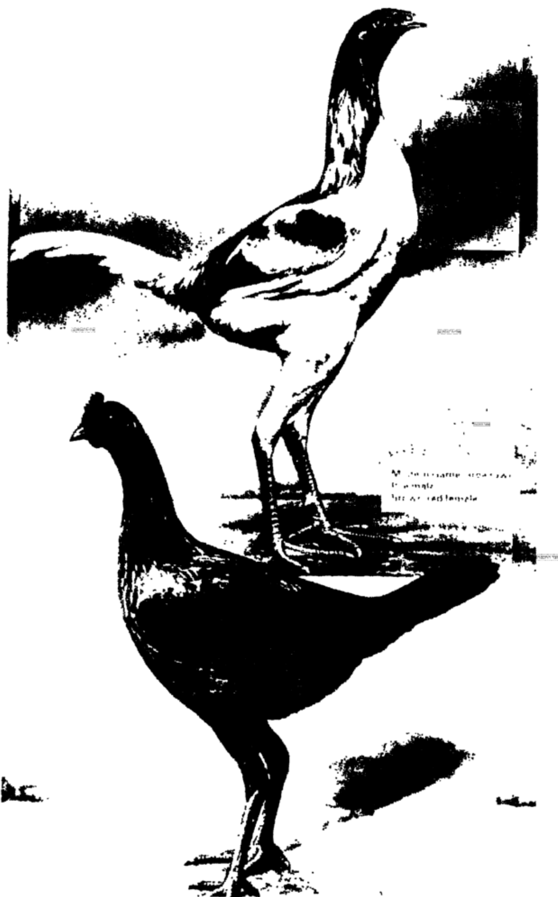
מיני תרנגול להכלאה