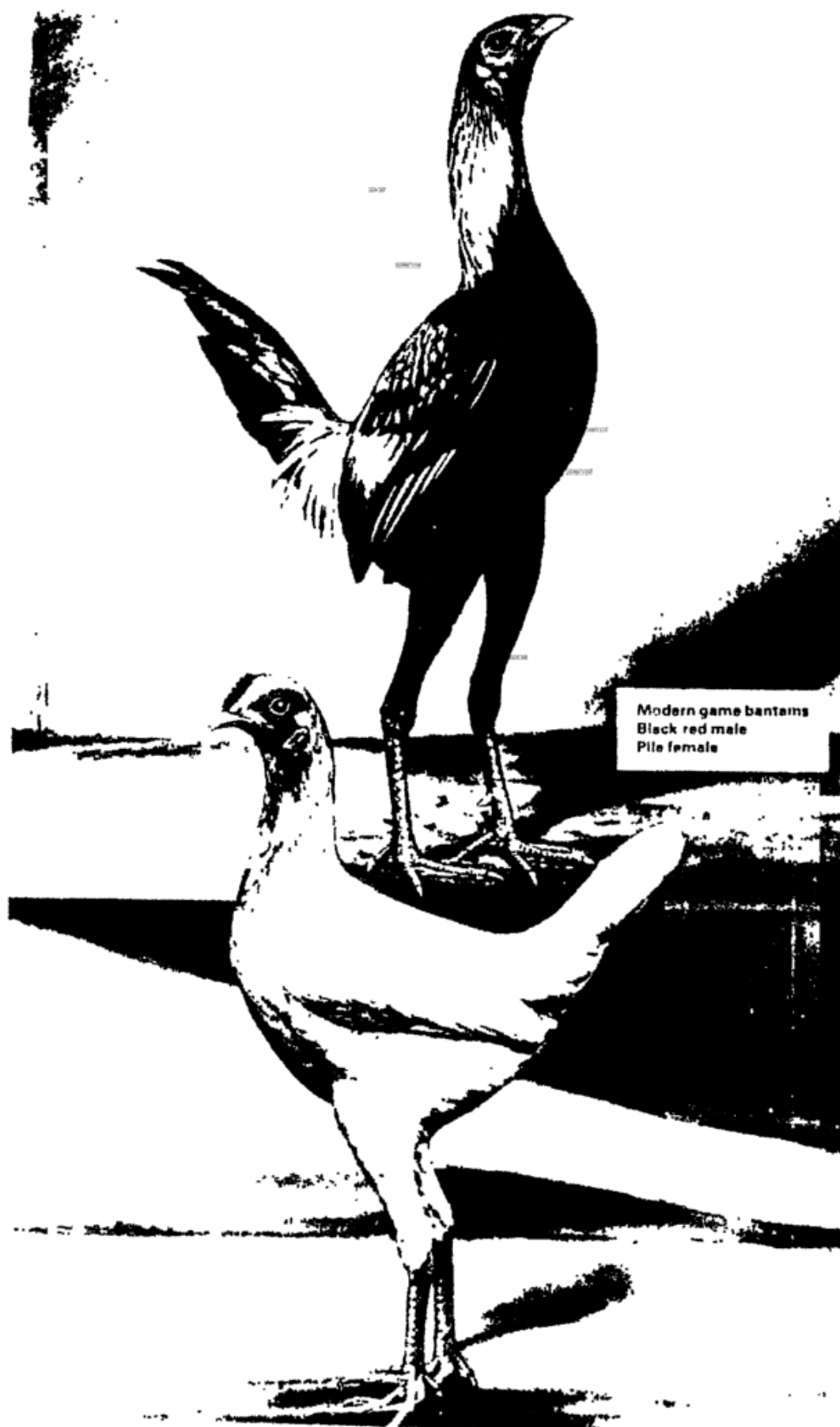
תרנגולי "קרב" מהם מכליאים מיני תרנגולי בשר