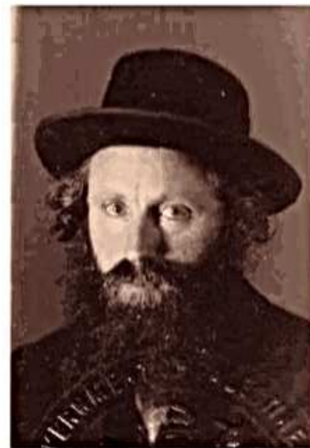
הגדולי דינקלס בשנות העמידה