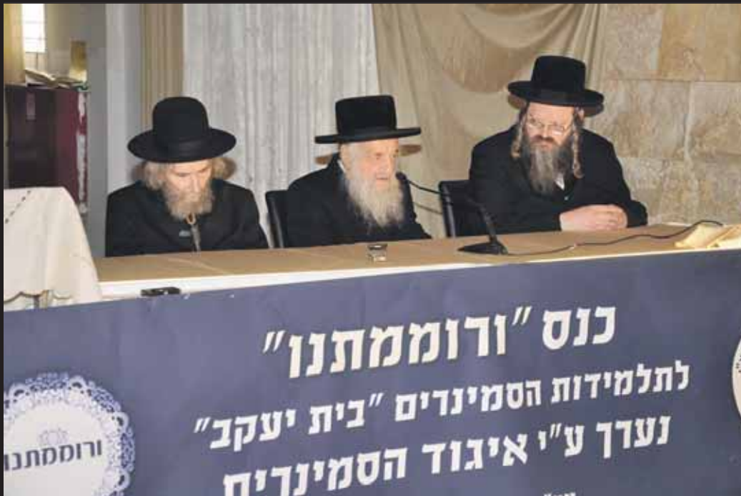
כנס צניעות באולמי וגשל עם בעל "שבט הלוי" זצוק"ל והגר"מ ש קליין שליט"א

מלבד משא עולם התורה עליו היכה כל ימיו במקל החובלים שבידו כמלאך האומר לו גדל גשא מרן זצוק"ל על שכמו את משא הדור כולו במשך שנים עמד בראש המערכות בכל הנושאים הקשורים לשמירה על טהרת הכרם ונטירתו מעינים הרעה וזוהמת רוחם של זוממי רע, אם זה בענייני החינוך על טהרת הקודש, הלימודים לבנות ישראל, ענייני הצניעות, פגעי הטכנולוגיה ובשאר החזיתות הרוחניות שיחות עם האנשים שעומדים בחזית בקרבות הבלימה וההגנה, בהכוונתו ובשליחותו – ומעתה גם ברוחו של קברניט העם | דבר לדור