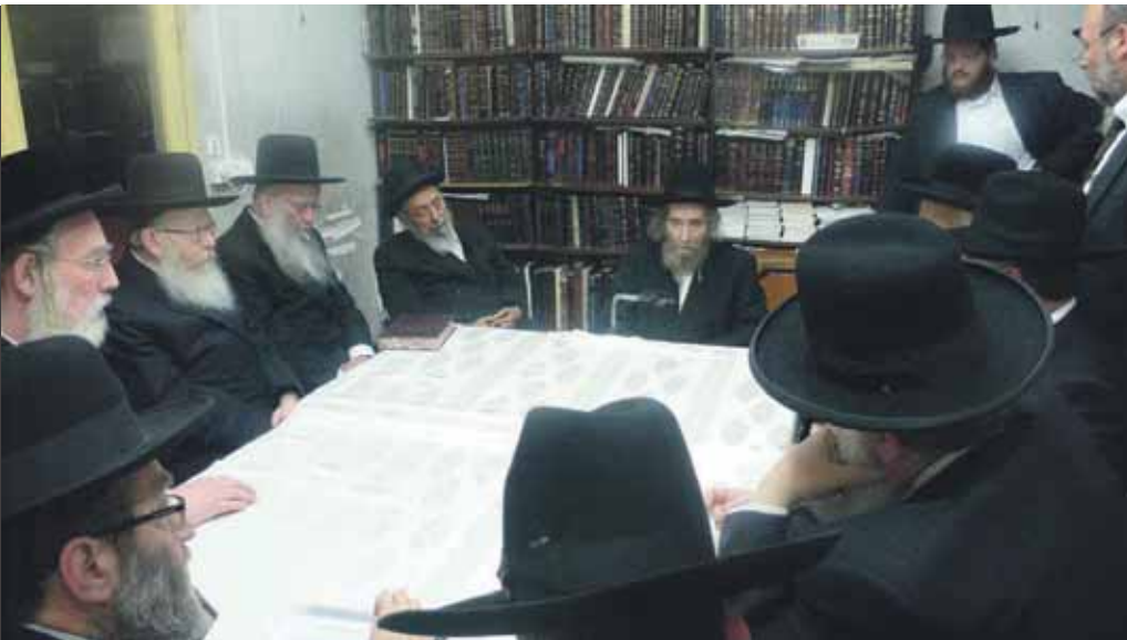
אסיפה במעון זכרון משה של מרן ראש הישיבה זצוק"ל בענין הסדרת מעמד בני הישיבות, בהשתתפות גדולי התורה וחברי הכנסת של יהדות התורה ויש"ס