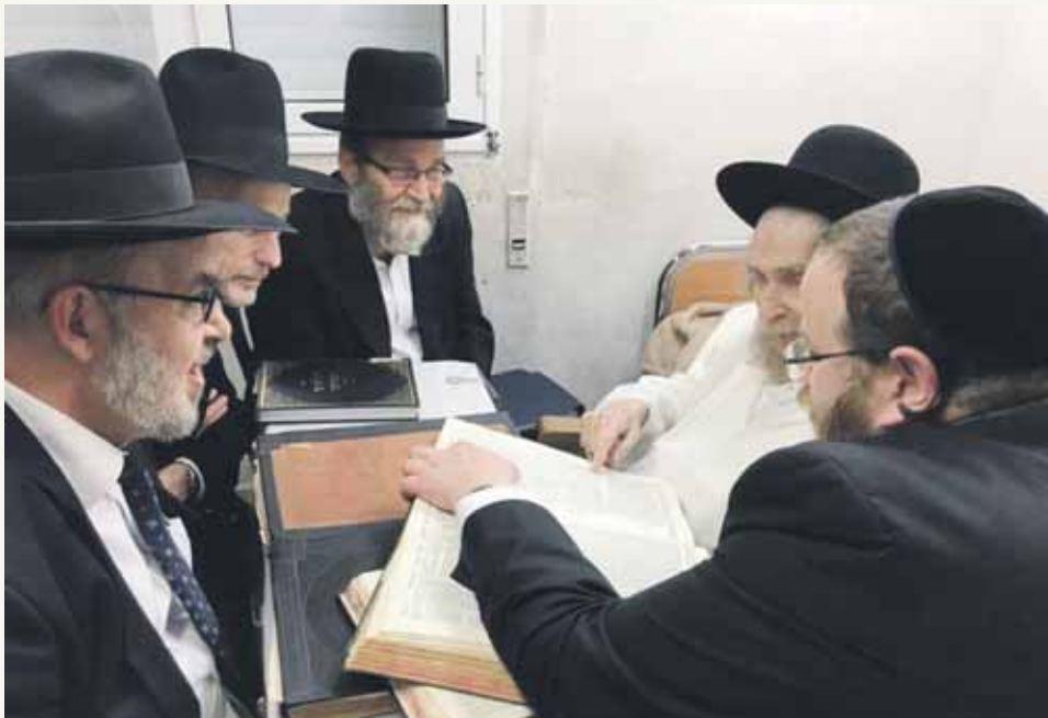
בבית התורה ומתכננת תורה לשלוחי דרבנן הדרך ילכו בה

משנתו והליכותיו, אני רואה הזדמנויות להעמיד את הדברים על מכונם כראוי בפני אלו המעוניינים לדעת האמת. אך אקדים, כי בכמה הזדמנויות שביקשנו ממנו לנפץ את השקר הגדול הזה, באמצעות מכתבים או שליחים וכדומה, הוא הסביר במתיקות לשונו שהיה פעם אדם שראה מולו אש מתפרצת, לקח צינור שהיה מחובר לקיר והחל להזרים לכיוון האש, אך מה רבתה פליאתו שבמקום שהאש תרעך, היא גרלה ומתעצמת. עד שברך את הצינור וראה שהצינור מלא בנפט... כשמכבים אש, צריך לוודא שבצינור יש מים, כי אם יש נפט, זה רק מגביר את האש. כך הוא הדבר גם כזה, כשיש אנשים שבנו בניינים ומגדלים שלמים, אם תוכיה שכל הדברים בנויים על יסודות של שקר ודברים לא נכונים, הם יתאמצו יותר להוכיח שהם צודקים ובעצם אתה מוסיף לשקר כוח ולא מגרע ממנו.