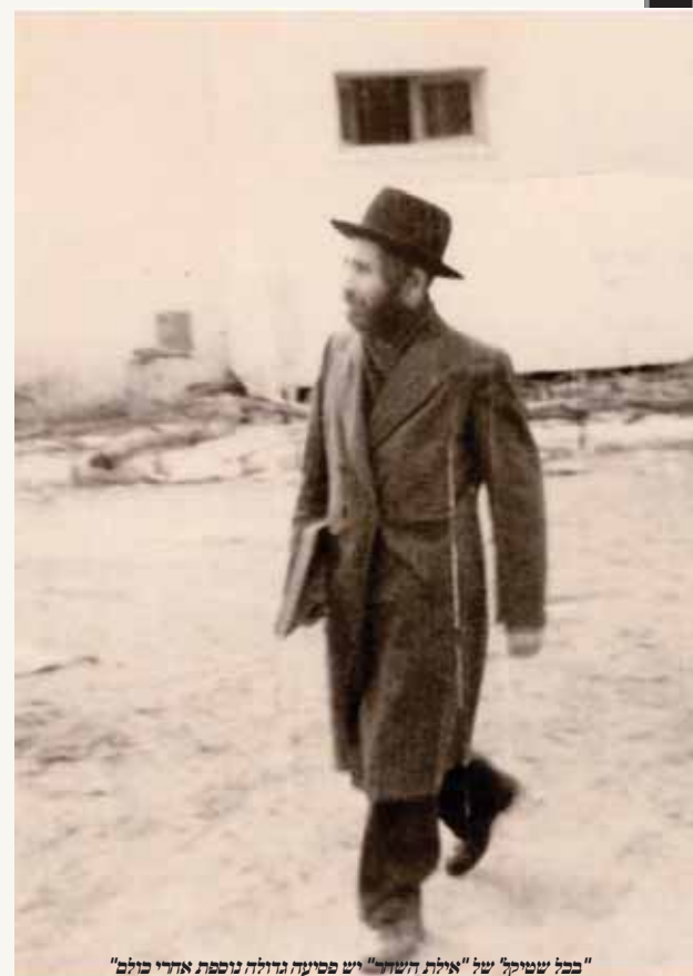
"בבל שטיקל" של "אילת השחר" יש פסיעה גדולה נוספת אחרי כולם"