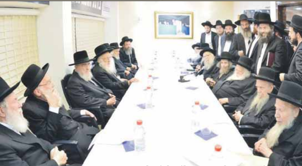
התכנסות לקראת ישיבת מועצת "ת ברשות מרן זצוק"ל בבית "דגל התורה"

ראש הישיבה זצוק"ל בענייני הציבור רומה לחלוטין להנהגת מרן החזון"א זצוק"ל, בשום שכל, בתבונה, ביישוב הדעת ובדרך כבוד לנוגעים בדבר. ואף הוסיף וביקש שנמסור בשמו את הדברים למרן זצוק"ל. ידוע לי שהגאון הגדול שליט"א גם כתב דברים אלו בכתב. כך גם העידו עוד מגדולי תלמידי מרן החזון"א זצוק"ל.