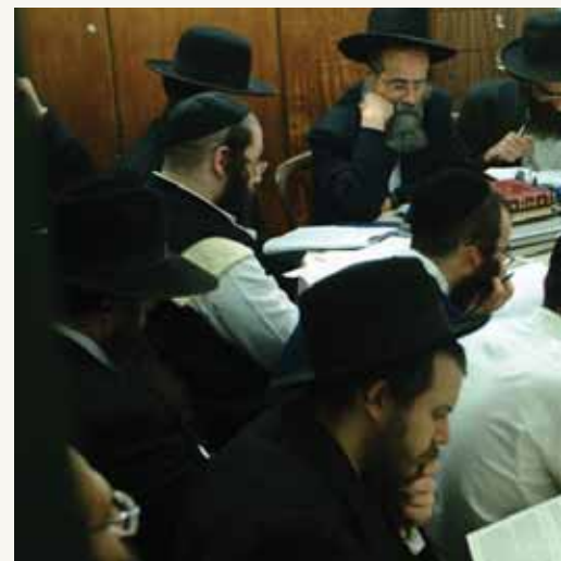
שיעור חומש, אחד מיני השיעורים הרבים בתוך חדרו

אם חפצים ללכת לאורו, נשנן לעצמנו כי 'האוסר הגדול ביותר' לאדם הוא לימוד התורה. וכפי שזכינו לראות כל השנים, את השמחה והאוסר על פני רבינו, וזה הכל נובע מלימוד ושקיעות בתורה, ואשרי אלו שזכו לראות את האור בפניו בזמן מסירת שיעור, ובשנים האחרונות היה מתקיים בביתו כל שבוע שיעור לבני תורה המופלגים מיישיבתו 'ארחות תורה', והכל ראו איזה אור נסוך על פניו, בכל קטע גמ' וכל סכרא שדובר, אשרי עין ראתה. יתן השי"ת שנזכה להרגיש מתיקות התורה, אפילו אחר מאלף ממה שהרגיש רבינו, ונהיה מאושרים בזה ובבא".