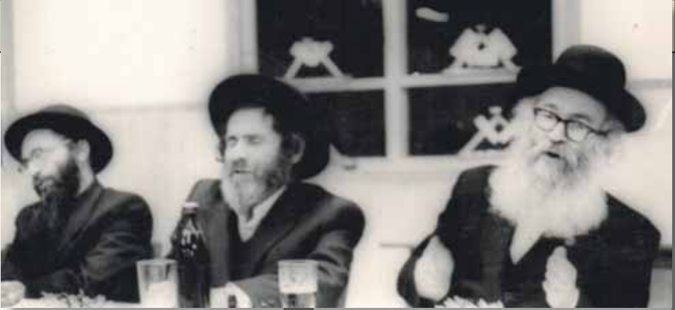
עם מרן הגר"מ ליפקוביץ והגר"נ נבנצאל - זצוק"ל

התמונה שעולה משיחות עם מגוון תלמידים היא שמרן ראש הישיבה זצוק"ל, צמצם עצמו לתוך ד' אמות רחבות מאד אך מוגדרות ביותר של השפעה בתוך הישיבה. הוא היה איתם אבל לא היה שם... כולם מתארים דמות של שרף עליון שהם מגסים לחדור לעולמו מבעד לקפלי טלית מסתירים, מעבר לדלת של חדר סגורה בה שומעים רק את קולו מתרונן על גבי ספרים