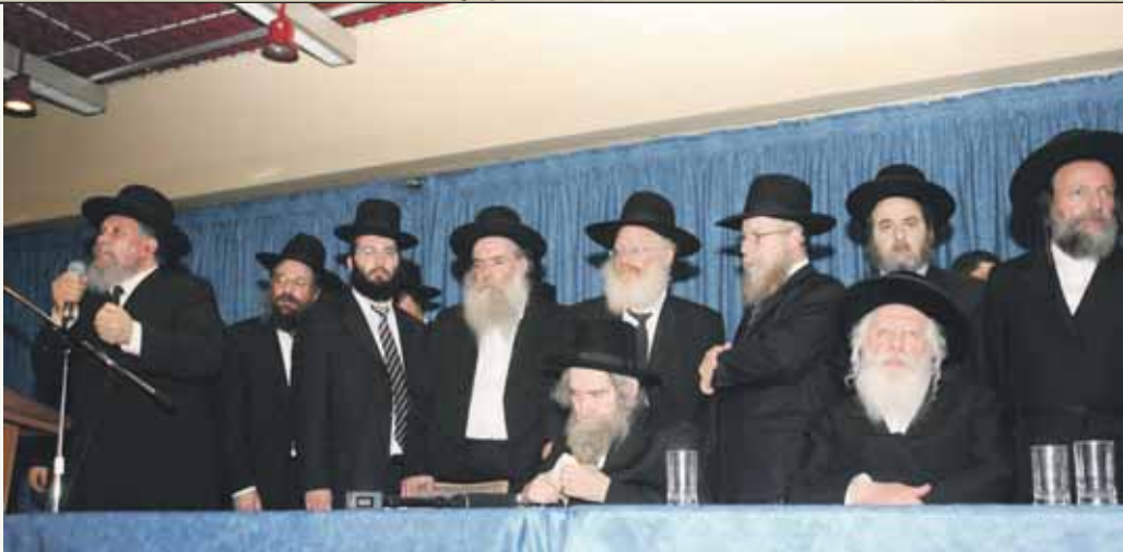
הגאון רבי יואל טובול שליט"א באירוע המרכזי לכבוד מרן זצוק"ל ויבלחט"א ב"ק האדמו"ר מגור שליט"א בליון