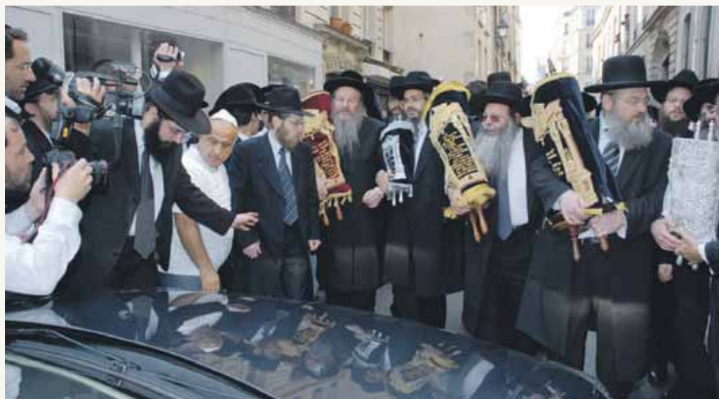
קבלת הפנים עם ספרי התורה ברחובות פריז

דמויותיהם של גדולי ישראל שהשתקפו אל תוך הזכוכית, הכפילו את ההתפעלות. הטרמינל הקטן אינו מורגל במראות מהסוג הזה. מרן יושב על הכסאות האדומים, וההמונים סככו עליהם כמו צדפה המגוננת על פניה. לא