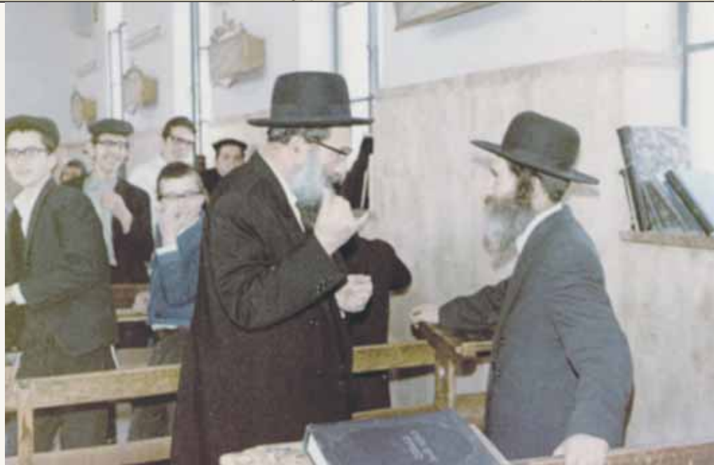
בריתא דאורייתא עם מרן הגר"ש רוזנבסקי זצוק"ל

"מרן זצוק"ל" מספר הגר"ד שליט"א "לא היה מעיר כמעט לבחורים בשיעור, לכן כשהיה מעיר היה לכך את העוצמה וההשפעה החזקה. היו פעם שני בחורים בעלי מרץ תוסס שהיו צרים זה לזה. פעם בשעת אמירת השיעור תפס אחד מהם את הסטנדר של רעהו והשליך מהחלון היישר אל ה'יער' שמאחורי הבניין. קשה לראות מגיד שיעור שלא יגיב בתקיפות למעשה כזה, אבל מרן זצוק"ל הגיב במילה אחת של הערה. זה היה מספיק, המסר היה ברור, לא היה צריך יותר."