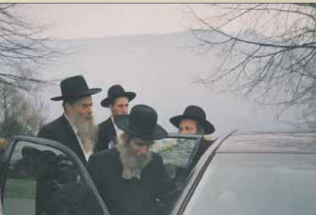
באקס-לע-בען למרגלות האלפים: "למח נאמר מח נאור על החרים רגלי מבושר ולא מח נאור רגלי המבושר על החרים, אלא שכל כבודם של החרים הוא שיבואו עליהם רגלי המבושר"