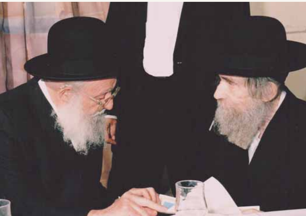
עם הגאון רבי ב"צ פלמן זצוק"ל. קשר של הלכה

וענהו מרן ראש הישיבה זצוק"ל: ביטול תורה זה הרבר הכי חמור שיש ובוודאי דוחה המעלה של 'זריזין מקדימין'.