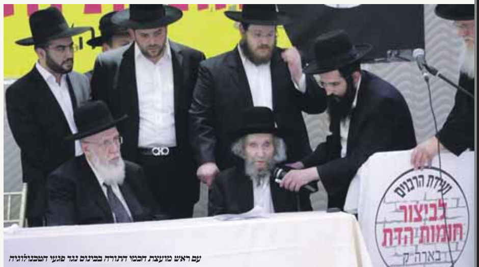
עם ראש מועצת חכמי התורה בכינוס נגד פגעי הטכנולוגיה