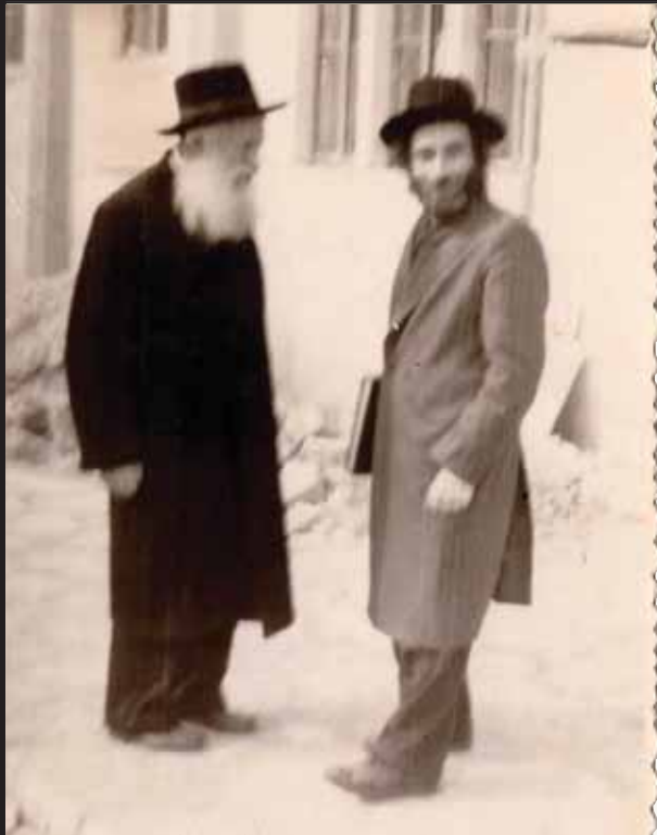
עם מרן נאב"ד פוניבז' זצוק"ל שקראו לעמוד בראשות הכולל