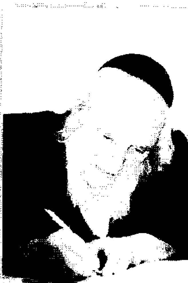
הגאון רבי שמואל אויערבך