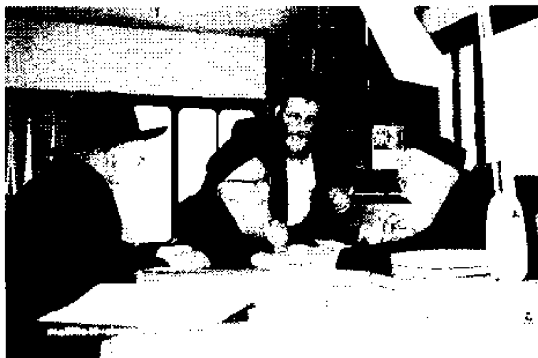
עם אביו אצל רבי אלעזר מנחם שך

האיש על העדה, אשר יוציאם ואשר יביאם. אף פעם, לא זכורה לי פעם אחת שבה הרהר או ערער אחר הכרעותיו.