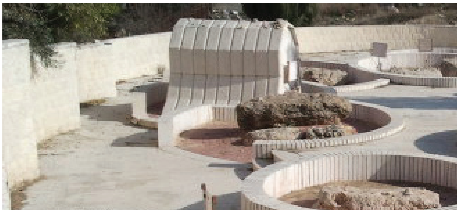
ציורו של רבנו בחלקת הרבנים הספרדים בבית העלמין העתיק בחברון

לאחר תקופה מסוימת, כאשר כלו דמי השוחד מכיסה, באה אלי הערבית והתחננה לפני שאסלח לה על העוול הנורא שגרמה לי. היא הבטיחה לי שהיא תלך ותפרסם ברבים את כל האמת ותאמר שהיתה זו עלילת שווא