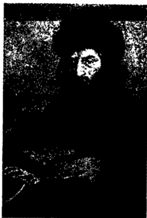
בעל החתם סופר זיע"א

אביו ואמו עודדו אותו בלמודו, אף כי לא היה זקוק ביותר לעידוד זה, כי השקיע את כל עצמיותו בלמוד התורה יומם ולילה. מסופר כי לאמו היתה „מגילת יוחסין“ עתיקה ביותר, אך משנודע הדבר לבנים היא שרפה אותה ואמרה: „חוששת אני שמא יסמכו הבנים על המאמר „התורה מחזרת על אכסניא שלה“ ולא יהיו הוגים בתורה, מוטב להם שלא יידעו על יחוס, ולא ירגישו עצמם פטורים מעמלה של תורה“.