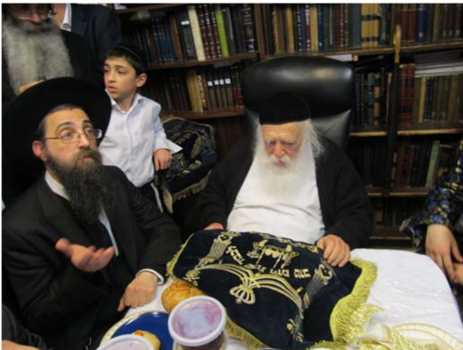
כל הזכויות שמורות ©

ומנהג רבינו עצמו שמתחיל הסעודה סמוך לשקיעת החמה וגומרה עם צאת הכוכבים, ומיד פונה לתפילת ערבית עם קריאת המגילה, כדרכו שסובר לקרוא בבני ברק את המגילה משום שנחשב ספק מוקפין.