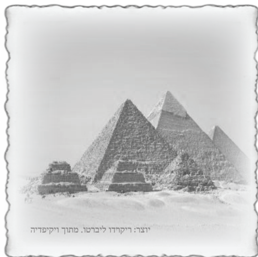
יוצר: ריקרדו ליברטו. מתוך ויקיפדיה

לפי זה מסביר 'בעל הטורים' את דברי הקב"ה לעם ישראל בפרשת שמות 3 - "פקוד פקדתי אתכם":