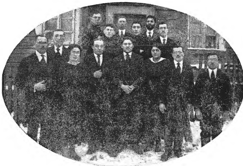
הוועד של ה"קולטור פאריין" (1917).

האגודה נוסדה בשנת 1916 בתקופת הכיבוש הגרמני והתקיימה מספר שנים. עקב תנאי המלחמה היתה העיירה מנותקת במידה רבה אף מהסביבה הקרובה. חוג של משכילים ועסקנים הרגיש את הצורך להקים אגודה לתרבות יהודית, על מנת לעורר במקצת את החיים הרוחניים והחברתיים של צעירי העיירה ולתת גם פורקן לעסקונתם. האגודה היתה מקיימת ערבי הרצאות על נושאים שונים או הקראות מתוך הספרות היהודית. כן היו נערכים נשפים ומסיבות חברתיים. נוצר גם חוג דרמטי במסגרת האגודה, שהציג מספר הצגות תיאטרון.