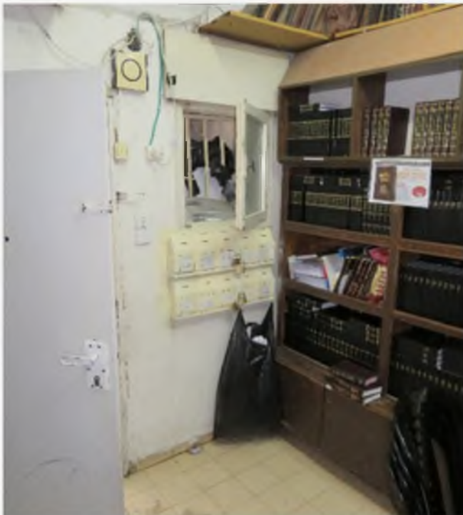
בתמונה: החלון [פתוח למחצה] בגובה כמטר וחצי, הסמוך לדלת הכניסה, שממנו קפץ רבינו לתפילת ערבית

מטר וחצי, השחיל את ראשו וגופו מהחלון וקפץ החוצה מן החלון! ולאחריו האורח וירדו לבית הכנסת. למחרת, כשהגעתי לביתו, הוא ראה אותי וחיך תוך כדי שהוא מעיר לי 'למה נעלת אותי אתמול?... העובדה הזו נחרטה בזכרוני, שמעידה יותר מהכל על הקפדה בכל קוצו של יו"ד.