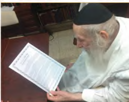
מרן הגר״נ קרליץ זצ״ל קורא בגליון כאיל תערוג תשע״ד

ולאחר מכן עיין ממושכות מרן זצ״ל בגליונות.