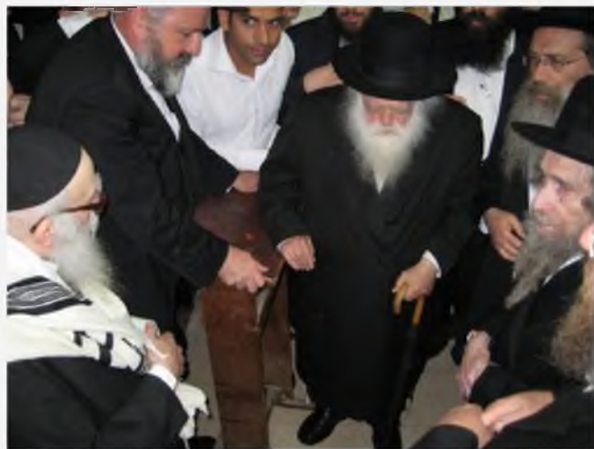
הגר"נ משמש סנדק בברית לנכד משותף של מרן רבינו שליט"א ולהבחל"ח רשכבה"ג הגרא"ל שטיינמן זצוק"ל

מבואר בספרו (חזון איש או"ח סי' ל"ז סק"א) שכירות שלנו דינן כאינה גרופה וקטומה ואם הורידו מהכירה אסור להחזיר, ומכל מקום לכופף את הקדירה ולשפוף מותר וזה לא נקרא שהורידו כל זמן שלא הורידוהו לגמרי, והרב ר' נסים קרליץ נ"י העיד שבסוף ימיו חזר בו וחשש להחמיר לכופף את המיחם וצוה לעשות כף להוציא מהמיחם. עכ"ל. וכן כתב רבינו שליט"א בספר גנזי שערי ציון, עמוד כ"ט אות כ"ז שמרן זצ"ל חשש בסוף ימיו להחמיר.