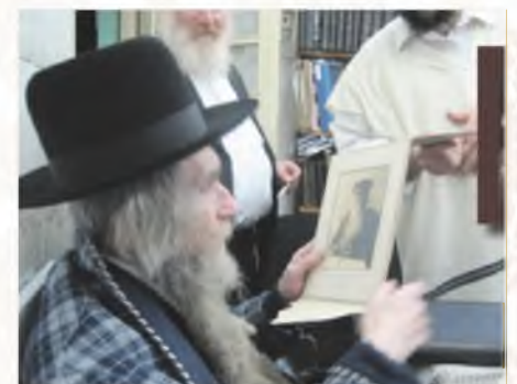
רבנו מביט בערגה בתמונת ש״ב הגר״ד שמחה זעליג ריגר ה״ד

סיפר רבנו על אמא שלו, שהיה נהוג בעיירה שהנשים הגויות הפריצה והגבירה היו מחזיקות בבתיים נשים יהודיות משרתות כגון תופרת חיי וכדו', ואמא שלו היתה