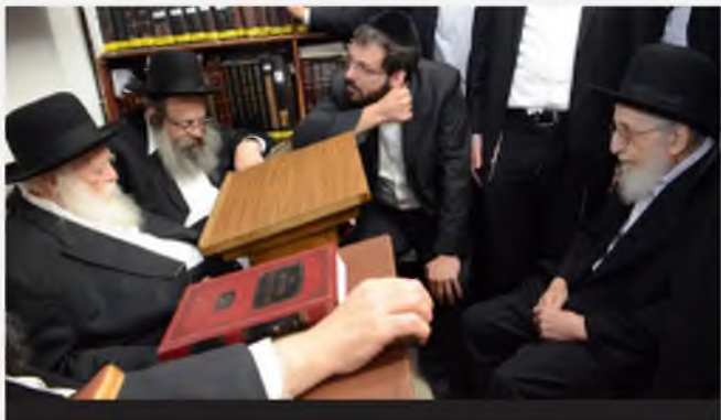
רבינו מקבל תנחומין בשתיקה. בתמונה בעת שהגיע הגאון רבי שמואל איינשטיין זצ"ל, לנחם את רבינו להבחיל"ם שישב שבעה על רעייתו הרבנית ע"ה

אצל רבינו הדבר בולט בכל הרפתקי דערו עליה במשך החיים, הוא לא שאל שום שאלות ולא הקשה קושיות. מה שהקב"ה עושה זה עצמו התשובה.