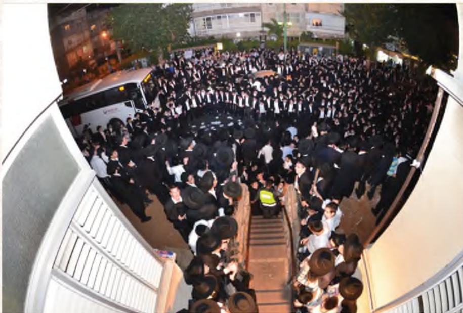
המונים צובאים על הפתח ברח' חזון איש ליכנס לקדוש פנימה.

במשך שנים היה מקבל קהל בעמידה. ושמעתי שאמר שירא ממה שאמר חז"ל (מובא ברש"י שמות יח, יג): וישב משה לשפוט את העם ויעמוד העם – הוקשה הדבר ליתרו שהיה מזלזל בכבודם של ישראל והוכיחו על כך, שנאמר מדוע אתה ככה יושב לבדך וכולם