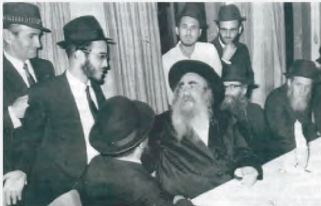
תמונה נדירה של מרן הגה"ק בעל הקהילות יעקב זי"ע מקשיב לדרשת נכדו החתן רבי חיים קלופט שליט"א בשמחת נישואיו (ביטאון מודיעין עילית, תשרי תש"פ)

ומה הגיב רבינו? לא היה לו בכלל שאלות, לא היה קשה לו כלום ממילא הוא לא נזקק לשום תירוץ... אבא אמר? ילד מקיים!