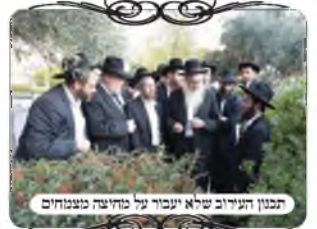
תכנון העירוב שלא יעבור על מדידת מוטות

בשכונה זו היו נתונים קשים מחמת ריבוי הצמחיה העבותה בכל החצרות, והיה צריך לתמורן ולהעמיד את צורות הפתח במקומות כשרים, כדי שלא תהיה מחיצה תחת צורת הפתח, וכן שיהיה מקום פנוי לפני כל עמוד ולחי בשיעור ד' על ד' טפחים. באחת הגינות היה צריך לעשות צורת הפתח במקום מסוים שהיה מלא בעצים ושיחים גבוהים. הבדק של המוקד מצא שיש קו מסוים שבו שני עצים ברוחב חצי מטר, במקום שהגננים מקפידים לגזום את הצמחיה והעוסקים במלאכה התאמצו לתכנן ולהתקין את העמוד באופן שהחוט יעבור בדיוק ביניהם, ועי"ז יכולים להעמיד את העירוב בצורה טובה. כמו"כ הוסיפו לגזום בתחתית השיח ג' טפחים כדי שיהיה מחיצה תלויה, שגם אם יצמח לא תהיה בעיה.