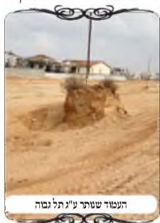
העמוד שחפרו ע"ז תל גבוה

אבל למרות זאת אמר האחראי, אני בבעיה קשה. כי הם חפרו עמוק סביב לעמודים, וא"כ העפר שסביב לעמוד הוא כעין תל ועמוד גבוה י" טפחים, ונמצא שהעמוד מוקף ברשות היחיד בפני עצמה. ועל כגון זה כתב המשנ"ב (סי' שס"ג ס"ק ק"ג) שאם העמוד נמצא בחצר המוקפת מד' רוחותיה, לא כלום הוא. א"כ למרות השמירה המיוחדת על עמודי העירוב, כביכול לא תהיה בעיה, אבל הנה הבעיה לא פשוטה.