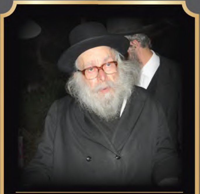
מרן פוסק הדור הגר"צ קרליץ זצוק"ל במלאת השלושים דברי הספד מנכדו

לתרומות והקדשות ע"ג הקובץ ניתן לפנות למס': 053-3145900