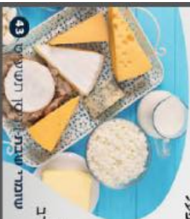
43 שומרי שבת: יום חשישי

יצור המזון ל פ ר ת מ ו ש ב ת מ ו ש ב ת כדי שגם בפרות יתקיים "מי שטוח בערב