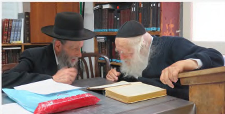
בתמונה: הגאון הצדיק רבי יצחק גרודזינסקי זצ"ל עם להבחל"ח מרן רשכבה"ג שליט"א.

רבי יצחק היה מזן המיוחד של אנשים שהרגישו שאף אחד לא חייב להם כלום. 'כל העולם לא נברא אלא בשבילי', נכון, זה במה שנוגע ביני לעצמי, אבל בנוגע לאחר, אדרבה, העולם כולו נברא עבורו... כך היתה שיטת חייו.