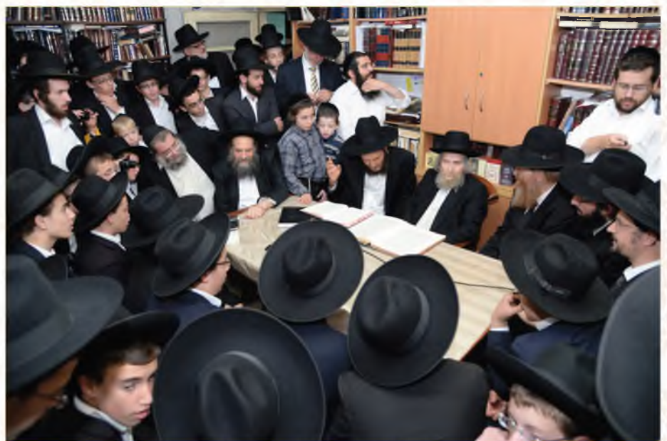
פתיחת ישיבת אמרי משה בביתו

בכנס הפתיחה בדרך רבנו שתהיה לישיבה סייעתא דשמיא, וייצאו ממנה אלפי תלמידים. ברכתו ותפילתו עושה פירות, שזכתה הישיבה