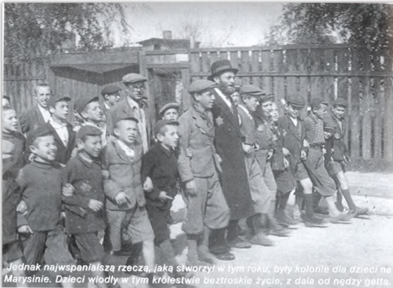
Jednak najwspanialszą rzeczą, jaką stworzył w tym roku, były kolonie dla dzieci na Marysinie. Dzieci wiodły w tym królestwie beztróskie życie, z dala od nędzy getta.