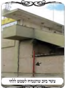
צינור ביוב שהתנחלד לשמש להי

בתקופה זו נסענו יחד עם כמה תלמידים לבדוק עירוב באחת מערי הפריפריה, שיש בה כמה מאות משפחות חרדיות, אבל העירוב אינו מתוקצב מספיק מהעירייה ולכן אין אפשרות להעמידו כראוי. אחד מהתושבים החרדים בעיר התנדב לטפל בעירוב, ועושה מגוון של פתרונות להכשירו.