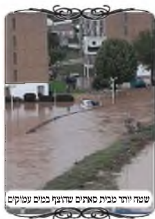
שטח יותר מבית סאתיים שהוצף במים עמוקים

שאלה נוספת שהתעוררה בימים אלו, בעקבות ההצפות הגדולות שארעו בעקבות הגשמים הרבים. מה הדין כשהוצף שטח גדול יותר מבית סאתיים, ברחוב, או חניה גדולה שתחת הבנינים, או שטח שעמד פנוי, והתמלא במים עמוקים, שבני אדם לא ישתמשו שם, האם זה נעשה כרמלית מדין מקום שאינו ראוי לדירה. והנה מקרה זה בדיוק מבואר בשו"ע (סי' שנו"א ס"א), קרפף יותר מבית סאתיים שהוקף לדירה, ונכנסו בו מים, אם אינם ראויים לשתיה דינם כזרעים, שהמקום נאסר, ואוסר את כל העיר הפתוחה אליו ופרוצה למקום האסור. ועי' בשו"ע שדיבר באופן שהמים עמוקים י' טפחים, וכיבאור הלכה (ד"ה והוא) האריך שח"ה בפתות מי ואפילו ג' טפחים, כיון שלא עוברים בו כל כך, אינו נחשב משמש לדירה. וכ"כ בחזו"א שכל שלא עוברים ומשתמשים בו הרי זה נאסר. ולפ"ז במקרים שהוצף שטח יותר מבית סאתיים בתוך העיר, לכאורה יהיה איסור מדין קרפף לכל העיר.