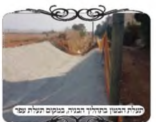
תעלת הבטון בתחילת הבניה, במקום תעלת עפר

בימים אלו של סערת הגשמים, כאשר מגלים את עוצמת הבריאה של ה', מקולות מים רבים אדירים, גם ללא סערת צונאמי, לא שיוורד גשם יותר מהרגיל, וכבר רחובות הערים הופכות לנחלים. יש בזה גם השלכות לשאלות הלכתיות בכשרות העירובים. נידון אחד לגבי תעלות הניקוז הקיימות בישובים, שזכות מלאות במים על גדותיהם, בחודש