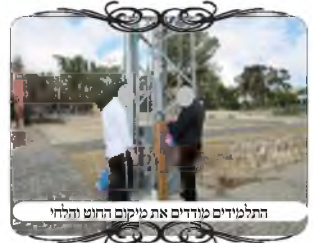
התלמידים מודדים את מיקום החוט והלחי

אך לצערנו לא בכל המקומות הלחיים היו מכוונות נכון תחת החוט. באחד המקומות קשרו חוט לעמוד חשמל באחד מפנינותיו, והעמידו למטה לחי ברוחב 10 ס"מ בלבד. במבט ראשון היה נראה שהלחי תחת החוט, כיון שהחוט קשור לפינת העמוד, וגם הלחי צמוד לפינת העמוד.