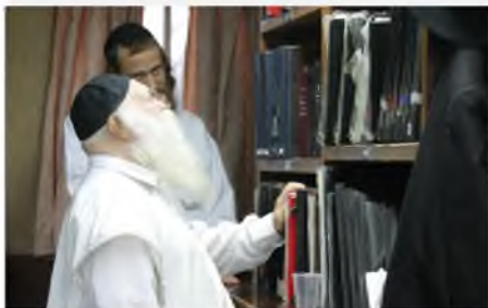
גם בשהותו בכולל אברכים, לא העיר הערות וביקורת. בתמונה הנדירה: רבינו שליט"א כאברך מן המניין בכולל אברכים 'חזון איש', מחפש ספר בארון הספרים.

כיוצא בזה סח רבינו שליט"א, על הנהגתו רבו הגדול דבן של ישראל מדין בעל החזון איש זי"ע, שהיו דרכו שלא לבקד ולהעיד לאחרים זולת מה שהיה מוכרח מסיבה שהיא, מהטעם הזה, אין ללמוד מכל מיני הנהגות והלכות שנהגו בקרבתו או בנכותו, כי יתכן שלא היה ניהא ליה אבל לא היה מדבב בביקורת כלפי אחרים.