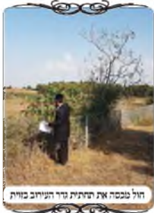
חול נספה את התחתית דרך העירוב בזווית

עוד מצוי בעיה הפוכה במקומות אחרים, שהמים סוחפים חול בכמויות גדולות, ולאחר שפוסקת הזרימה החזקה, יורד החול קרוב לגדרות ומצטבר ומכסה חלק ניכר מהגדר. ובאופן שגובה הגדר היה ' טפחים, מצוי שמתכסה חצי טפח, ונשאר בה רק תשע וחצי טפחים, וזה יכול לפסול את כל העירוב. אמנם בהרבה מקרים מדובר פחות ממי אמות ויש להתיר מדין עומד מרובה. אבל יש מקרים שהגדר מסתובבת ונעשה לפירצה בקרן זווית.