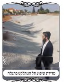
מודדת שיפוע תל המתלקט בתעלה

נשאלת השאלה מה הדין בימים של גשמים כשהתעלה מלאה במים, ואין משפת המים ומעלה י' טפחים, האם החלק המכוסה מצטרף, ומה הדין אם כל התעלה מלאה עד למעלה. שאלנו את האחראי האם יש מצבים שהתעלה מלאה עד כדי כך שכולה מוצפת. והאחראי הגיב בהנחיות, ודאי שבימי גשם גם התעלה החדשה מוצפת כולה, ואפילו בגשמים המצויים, לא רק בגשמים של שבוע זה. וא"כ מה דין העירוב כאשר יש שבת שיש בה גשמים והתעלה מלאה במים.