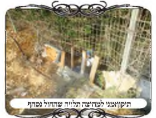
תיקון מני למחיצה תלויה שהחלל נסחף

במסגרת השיעורים התחלנו בלימוד דיני המחיצות המצויות בזמנינו, עם לימוד והמחשה על התקלות המצויות בכל סוג שהוא, ושנים מהם היו דברים הנוגעים במיוחד בתקופה זו, שיש זרימת מים גדולה בכל הערים, ובפרט בגבולות שמסביב לעיר, ולכן במקומות שיש גדרות רשת או סורגים [למעט קירות אבן], מצוי שהמים סוחפים את העפר והאבנים שמתחת הגדר, ונוצר חלל בגובה ג' טפחים (לחומר 22.5 / 24 ס"מ). והדין הוא שמחיצה תלויה ג' טפחים מעל הקרקע, לא שמייה מחיצה, כיון שהגדיים בוקעים תחתיה. ואפילו אם יש מעל החלל גדר בגובה י' טפחים.