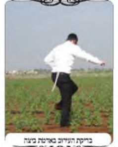
בדיקת העירוב באדמה ביצה

באחד הימים שהיתה קצת הפוגה והשמש יצאה על הארץ, יצאו הבודקים לבדוק שני ישובים שהמתינו כבר כמה שבועות שיבואו לבדק אותם, באחד מהם היו הרבה חצרות סגורות, והבודקים התחילו ללכת מאחורי הבתים במטע זיתים, שהאדמה שבו יותר יציבה. ובכל זאת האדמה נדבקה לנעליים, וכל נעל היתה כמו גוש גדול של בוץ, ונעשה קשה ללכת. לאחר מכן היו צריכים ללכת בין השדות קטע קטן, ורק נכנסו כמה מטרים, החלו לשקוע עמוק, עד כדי שכמעט קראו לעזרה. לבסוף אחד משך את חבירו והצליחו להחליץ, ולפחות לחזור על עקבותיהם. ולמדו מזה איך לבדוק עירוב בחורף, שלא להיכנס לאדמה כזו אפילו כשעברו כמה ימים אחרי הגשם. ומה הם עשו אח"כ, האם הם חזרו לבית להחליף בגדים, כמובן שלא, למרות שהם היו עטופים בבוץ, עצרו באחת מהשלוליות, ניקו את עצמם מעט במי השלולית, והמשיכו בבדיקת העירוב של אותו ישוב, ובישוב השני, עוד כמה שעות.