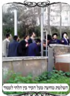
השליטה מודיעה מעל הקיר בין הלחי לעמוד

אחד מהדברים שנפגשנו במהלך הסיור הזה באחד המקומות שעשו שתי צורות הפתח שאחת מהם בתוך החצר ואחת מחוץ לחצר, ועל כן מתחו חוט מהעמוד שנמצא ברחוב אל הבנין, והעמידו לחי בתוך החצר משום שהגדר היא מחיצה שמפסיקה בתוך צורת הפתח העוברת בין העמוד לבין הבנין. בנוסף לזאת הוסיפו עוד ברזל ארוך שעומד מעל גבי הקיר בין העמוד לבין הלחי. וצריך ביאור מה הטעם להעמיד את הברזל הארוך הזה.