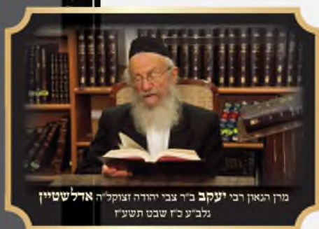
מרחן הגאון רבי יעקב אדלשטיין זצוק"ל נלב"ע כ"ז שבט תשע"ז

עוד יש סגולה גדולה ומקובלת בידי אנשי ירושלים ללכת מ' ימים רצופים להתפלל בכותל ושמעתי שאין צורך לגמור רק יאמר הקאפיטל או כמה ואח"כ יבקשו אך יש להקפיד שיהיו רצופים.