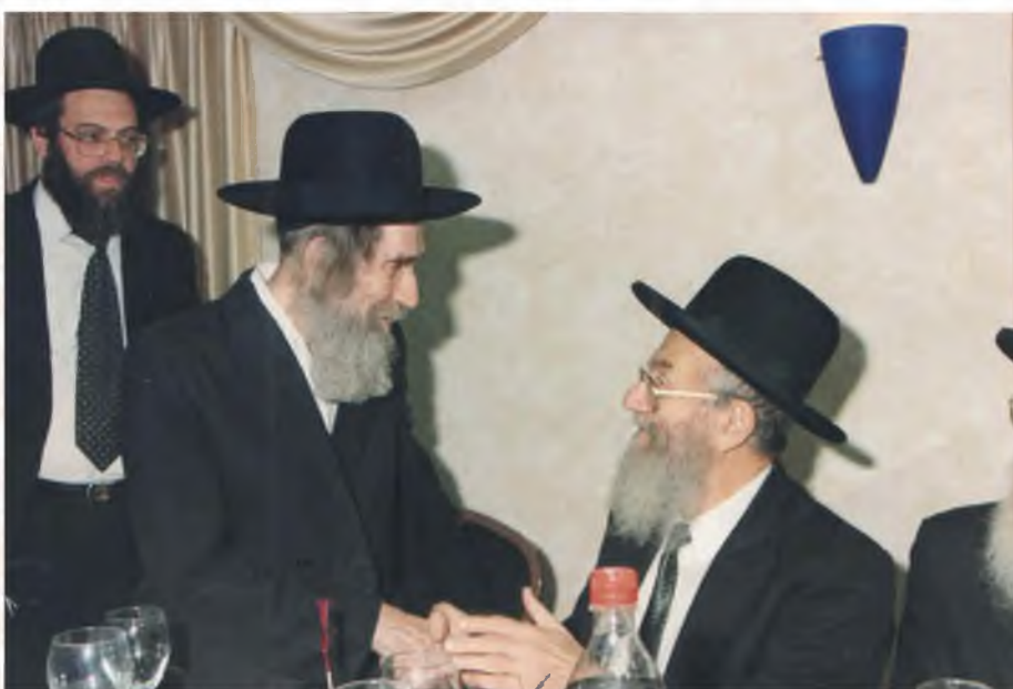
לרגל יום היארצית כ"ז שבט. רבנו משתתף בדינר שנערך למוסדותיו של הגר"י אדלשטיין לאחר שהתאושש מאחד הניתוחים שעבר

וכן לקבל צדקה מגזלנים ומחשודים על הגזל משמע דחמור יותר משאר עוברי עבירה, וכדאי' בב"ב קי"ג דאין מקבלים צדקה ממוכסין כשרוב כספם הוא מעבירה, ובתוס' שם כ' דלמ"ד דיאוש כדי אינו קונה וודאי דאין מקבלים דגול הם בידם, ואפי' למ"ד דיאוש קונה מ"מ מוגנה הדבר לקבל