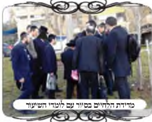
מדידת הלחיים בסניף עם לומדי השיעור

בשבוע זה נערך סיור ללומדי השיעורים בבדיקת עירובין סניף ירושלים, לראות בשטח את דיני העמודים והלחיים וללמוד את צורת המדידה של מקום החוט כדי שהלחי יהיה מכוון תחת החוט.