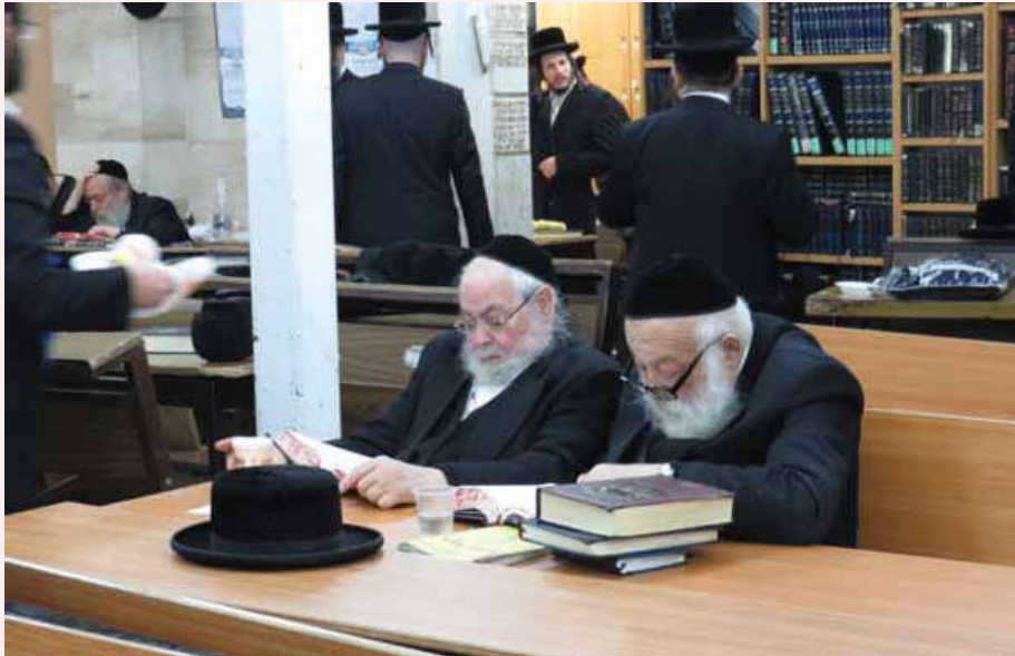
האם היה גמרא בזמן התנאים? יהודים הוגים בתורה הק' (אילוסטרציה, למצולמים אין קשר לכתבה)

במשניות ובברייתות; רש"י לא השתמש סתם בשמות נרדפים, אלא 'תלמוד' היינו פירושי התנאים למשנה, וגמרא' הוא פירושי האמוראים, שהוא התלמודים, הבבלי והירושלמי [בדפוסים צונור ל'בהש"ס ובגמרא'].