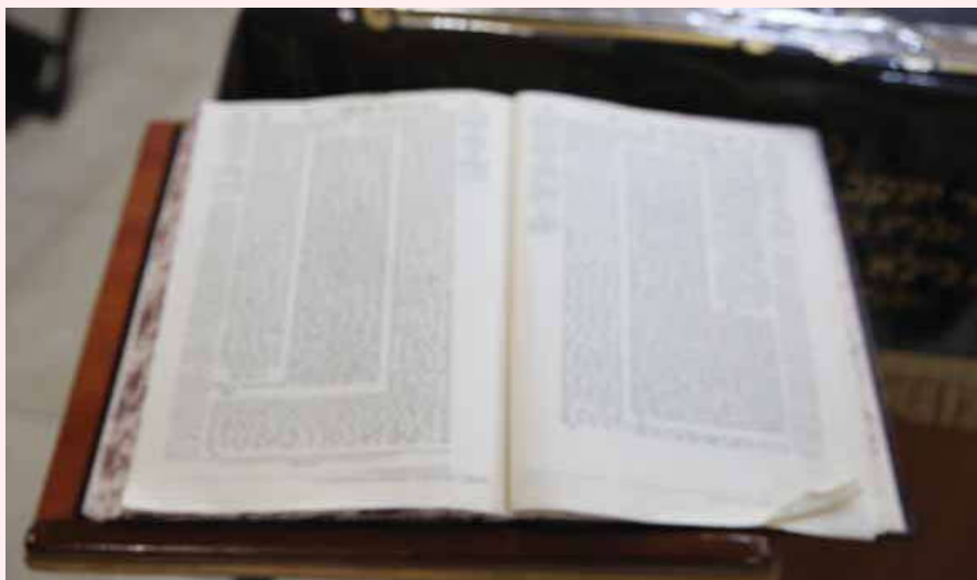
המילה "תלמוד" שובשה משום מה תמיד ע"י הצנזורה. גמרא