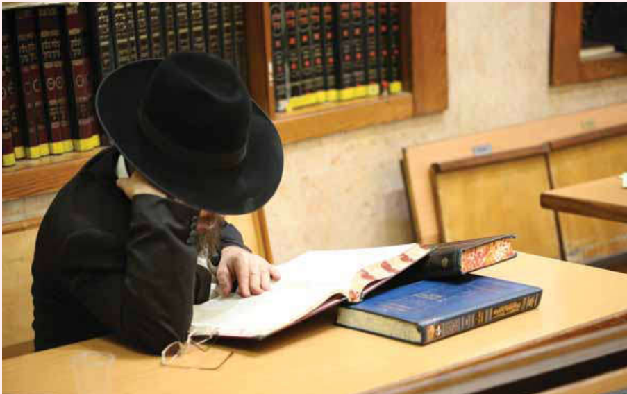
הבדל בין גמרא ל'תלמוד'. יהודי הוגה בתורה הק' (אילוסטרציה, למצולם אין קשר לכתבה)