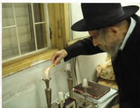
מרן בהדלקת נרות שבת

יש לקוות שיה' לתועלת להלומדים במסכת. וכעת יוצא לאור ספר על מסכת שבת אשר עליה נאמר בחגיגה ד' פ' שהוא כהרדים תלויך בשערה ויש בה גם הרבה מהסברות הדקות מאד, אשר זה מחדד את השכל להבין בהבנתה של תורה, שע"ז אפשר לעלות מאד גם ביראת שמים, אשר עליה נאמר הן יראת ה' היא חכמה ואמרו שבת דף ל"א ב' הן אחת היא,