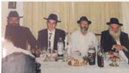
תמונה נדירה מלפני כשלושים שנה: מרן שליט"א לימין התמונה, יושב לסמוך לרב בורר, בשמחה משפחתית.

תנחומינו למשפחתו החשובה שליט"א, שהמקום ינחם אתכם בתוך שאר אבלי ציון וירושלים, ולא תוסיפו לדאבה עוד.