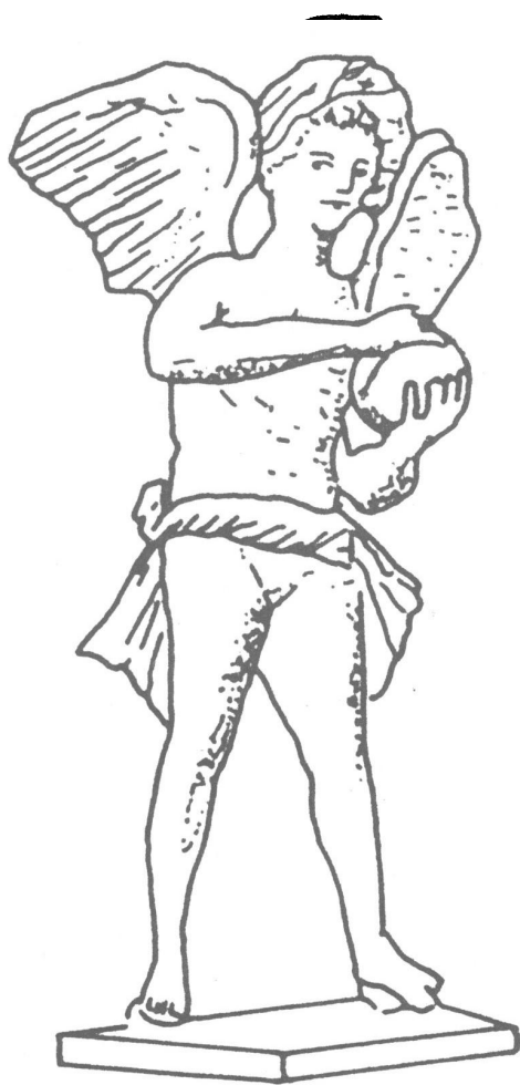
איור מס' 2. ארוס מחזיק בכדור, אולי מסוג follis (על פי Daremberg & Saglio [לעיל, הערה 7], עמ' 476).