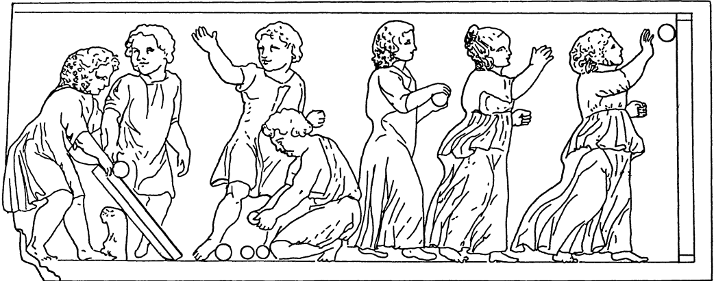
איור 5. ילדים במשחק. בצד שמאל גלגול כדור על קיר. בצד ימין ילדה זורקת כדור (ראה הערה 73). על פי באומייסטר (לעיל, הערה 73), עמ' 249, איור 228.

יש לדחות פירוש זה מכמה סיבות. הסוגיה מורכבת כאמור מכמה שכבות. זריקת הצרור בכותל משמשת אמנם רקע לסוגיה, אבל חוץ מזה לא נזכרת בסוגיה כולה זריקת כדור