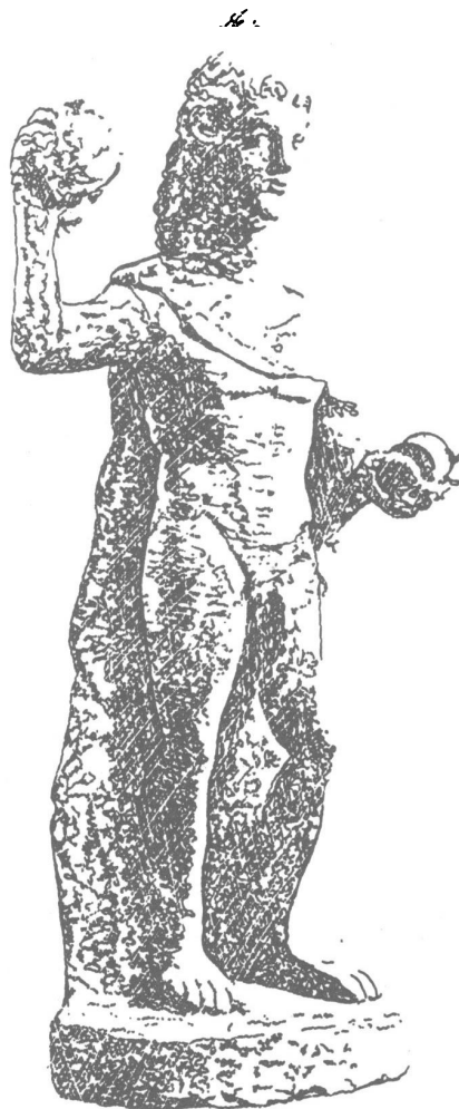
איור מס' 1. פסל שיש ממקדש אפולו בקוריון שבקפריסין (Episcopi Museum). ביד השמאלית יש שני כדורים וביד הימנית, בתנועת זריקה, כדור אחד.