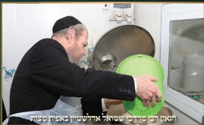
הגאון רבי מרדכי שמואל אדלשטיין באפיק מצות

יו"ל ע"י מערכת קובץ גליונות. נשמח לקבל מדי שבוע תמונות למדור חדש זה. נא להזהר מזכויות יוצרים וחשש גזל. תמונות יש להעביר למייל המערכת : k.gilyonot@gmail.com