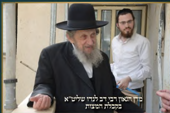
מורן הגאון רבי דב לנדו שליט"א בקבלת המצות