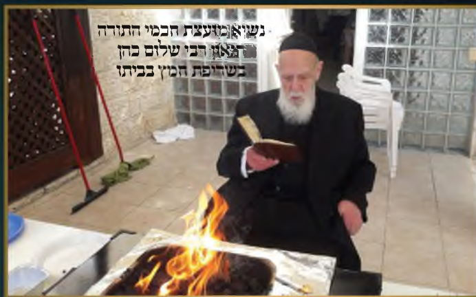
נשיא מועצת חכמי התורה הגאון רבי שלום כהן בשריפת המין בביתו