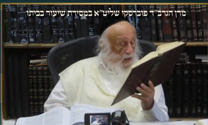
מורן הגרב"ד פוברסקי שליט"א במסורת שיעור בביתו