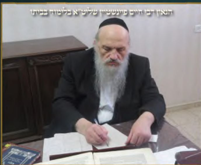
הגאון רבי חיים פיינשטיין שליט"א בלומוד בביתו