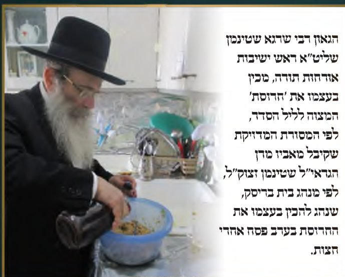
הגאון רבי שרגא שטיינמן שליט"א ראש ישיבות אורחות תורה, מבין בעצמו את 'הדרוסת' המצוה לליל הסדר, לפי המסורת המדויקת שקיבל מאביו מורן הגראי"ל שטיינמן זצוק"ל, לפי מנהג בית בריסק, שנהג להכין בעצמו את ההדרוסת בערב פסח אחר הצות.