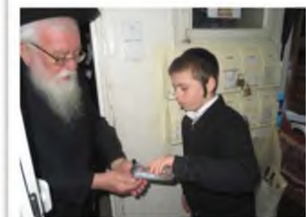
תקופת קורונה שנת תש"פ: בני הבית נוהרים במצות הבריאות, ובכניסה לביתו של מרן שליט"א שמים בחיך על היד חומר חיטוי.

אחד המכשולים הכי חמורים, שעל זה יחסי הורים - וילדיהם נגדעים באחת, היא על ידי התנהגות קטנה ולא נכונה בזמני לחץ. כשאדם לחוץ - הוא מלחץ. הדברים אמורים ביום יום אבל בעיקר בזמנים הלא שגורתיים. כשהורה מתנהג בצורה לא זהירה הוא יכול לגרום למכשול אדיר ולקרע שאינו מתאחה בהתנהגות הילד. בדברים אלו אין חידוש אך נתבונן כיצד אפשר להימנע בכך, באספקלריה המאירה של תהלוכות רבינו שליט"א. נדרשנו לנושא זה בעקבות בקשת רבים מקוראנו שיחי', עקב התקופה האחרונה שנועדה לנו מן השמים, בו המשפחות והילדים נצורים בבתים כל היום, ובמקרים רבים ההורים או הילדים נמצאים במתח ובלחץ מהמצב, והתגובות הבלתי צפויות יכולות להיות חלילה הוות אסון לדורות. פשוט וכמובן, כי נדרשת זהירות בשמירה על כללי הבריאות, כמו שציוות תורה ונשמרתם מאוד לנפשותיכם, אבל המתח הקיים סביב הנושא הוא רחוק ממצות 'ונשמרתם', ואדרבה, זה מרחיק את הנפש משמירת התורה.