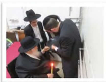
הכנה כפולה לזמני לחץ, לדאוג להיות רגוע ביותר. רבינו בבדיקת חמץ בסבלנות ורוגע במשך כשלוש וארבע שעות.

אירע פעם, וכשבדק את אחד מארונות הבגדים, הוציאו את ערימת הבגדים לבדוק שאין תחתיהם שום חשש חמץ ח"ו, ומתוך מהירות החזירו את הדברים שלא לפי הסדר, נענה רבינו ואמר: צריך לסדר כל דבר במקומו שלא יהיה הדבר לטירחא עבור הרבנית (ע"ה) שכן הצער והטירחא שעלול להיות לה מזה גם הוא דאורייתא!!!