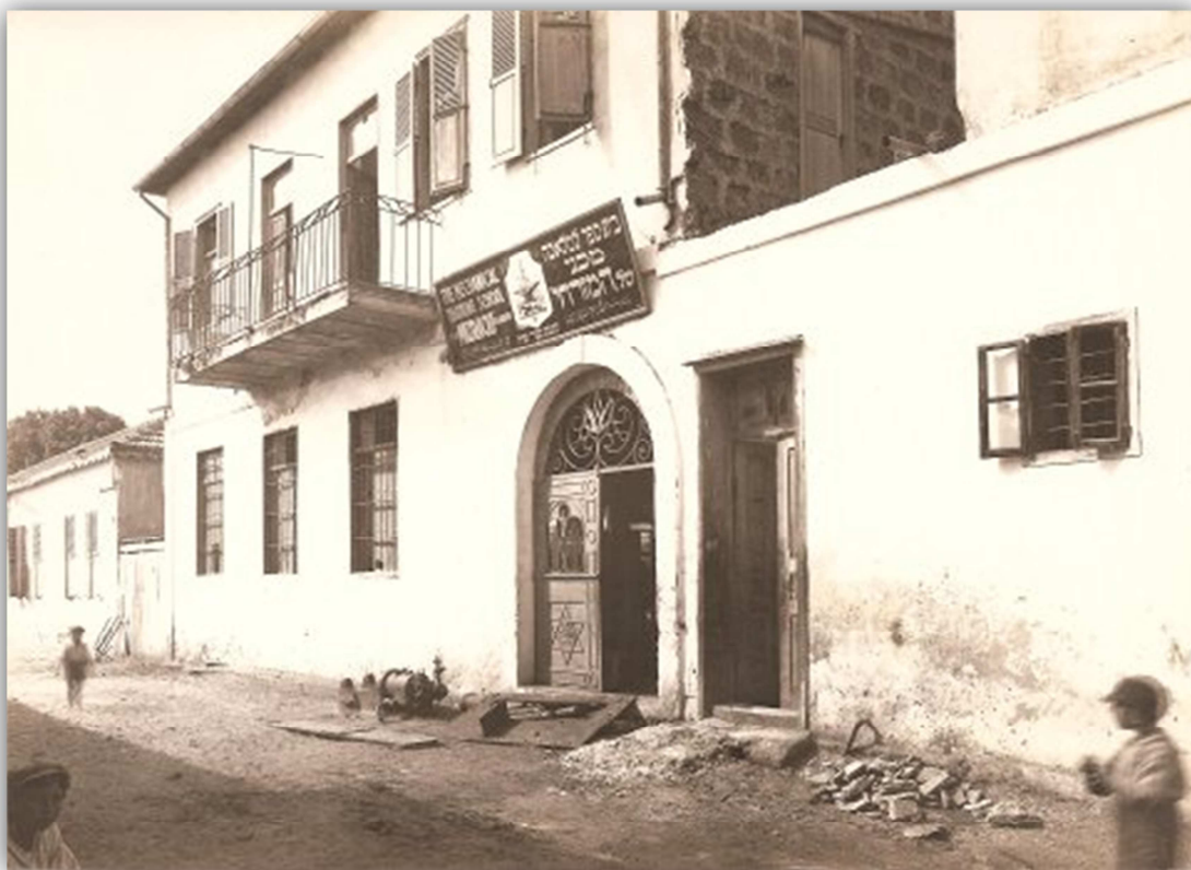
מבנה 'שערי תורה'. בקומה העליונה שכנה ישיבת-הבחורים

בתקופת רבנותו ביפו הקים הרב קוק ישיבה חדשנית לבחורים מוכשרים אותם קיבץ אחד לאחד מרחבי הארץ והעולם • סדר הלימוד בישיבה היה נועז וחריג ועורר את התנגדותם של קנאי ירושלים • שש שנים פעלה הישיבה, שמעה יצא ברחבי העולם, למדו בה עשרות תלמידים, מיטב המורים לימדו בה, ובכל זאת איננו יודעים עליה כמעט מאומה • מי היו התלמידים ומה נכלל בתכנית הלימודים? • כיום הבניין חרב, שעריו נעולים, והתעלומה אופפת את המקום