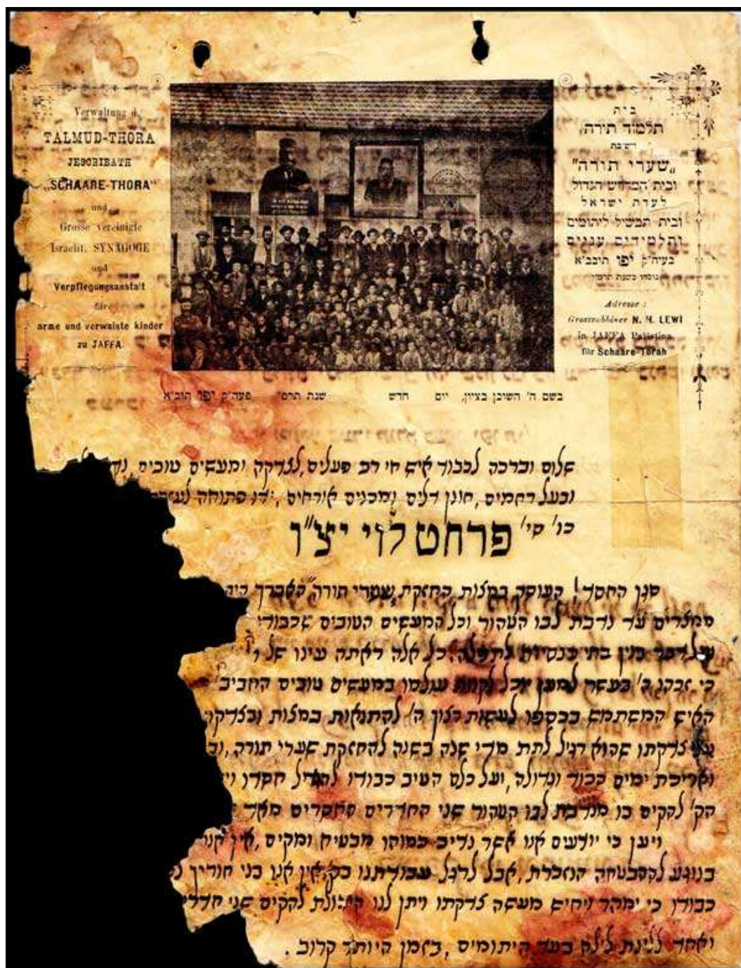
מכתב ששלחו הראי"ה קוק ומנהלי 'שערי תורה' לאחד מהנדיבים שתורמו סכום נכבד לטובת המוסד