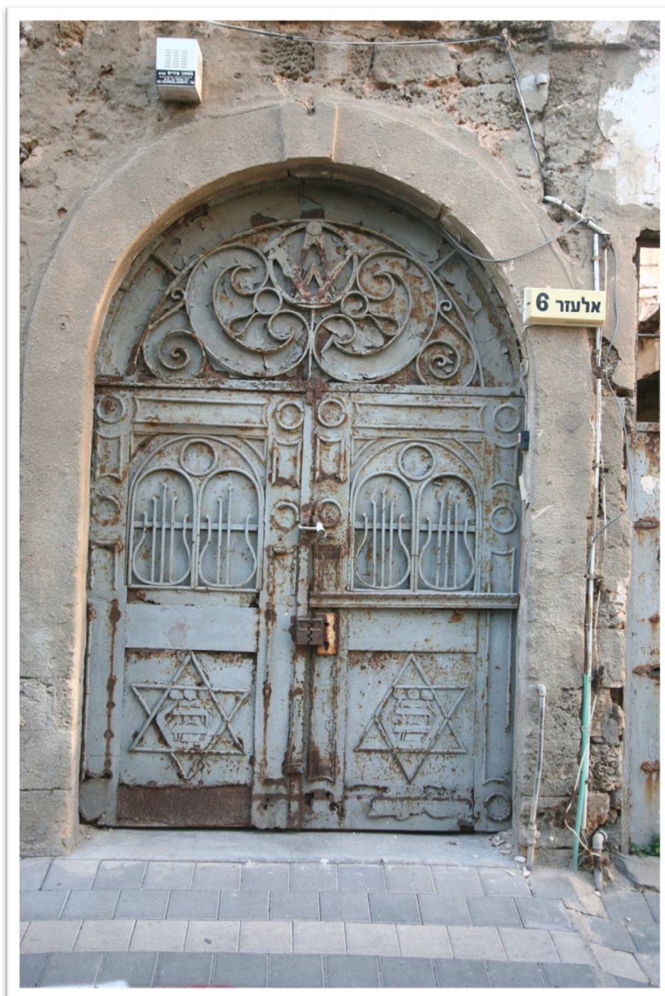
שער המבנה 'שערי תורה' כיום. דלתות אלו נבנו ע"י תלמידי בית המלאכה שפעל במקום

עם זאת, יש לזכור שהישיבה פעלה במשך כשבע שנים, ותלמידים נכנסו ויצאו בה, כך שסביר להניח שבסך כל שנותיה של הישיבה, מספר התלמידים שהתחנכו בה הגיע לעשרות רבות.