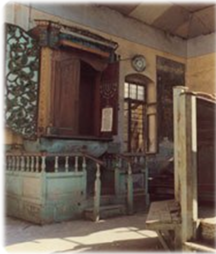
בית הכנסת ובית המדרש ב'שערי תורה' (1980)

"כאשר יווכחו שכל אותם הפחדים הדמיוניים, שמפחדים מנהלי המוסדות הישנים, מפני כל שינוי לטובה, אע"פ שהוא מוכרח מן התורה ומן השכל הישר, שהוא יסוד הסברה הברורה, שהם פחד לא הי' פחד, ולהיפך: ע"י 'שב-ואל-תעשה' שלהם הסכנה היא בולטת, שכיון שכל המתחנכים תחת ידי בעלי תורה ויראה אינם מתכשרים ללכת עם החיים, לא מצד ידיעותיהם ולא מצד הנהגתם ונימוסיהם, ממילא נעשים הם בגדלם לאנשים חלשים, נמוגי רוח, ומוטלים על הציבור, וההולכים בדרך ההרס ההולכים ע"י זה ומתחזקים במפעליהם, אע"פ שסופם הוא הריסה מוחלטת, המורגש יפה למי שיש לו עין צופיה, - ואחר כל אלה הנני להעיר את כבודו, שרק אז כשיהיה לנו על מה להראות באצבע, אז יודו לנו גם הישנים שכונתם לשם שמים, וממילא יתפשט החידוש לטובה על כל בתי החינוך והשיבות בארץ-הקדש, ויתרבה עז ותעצומות לעם הקודש בדרך אמת".