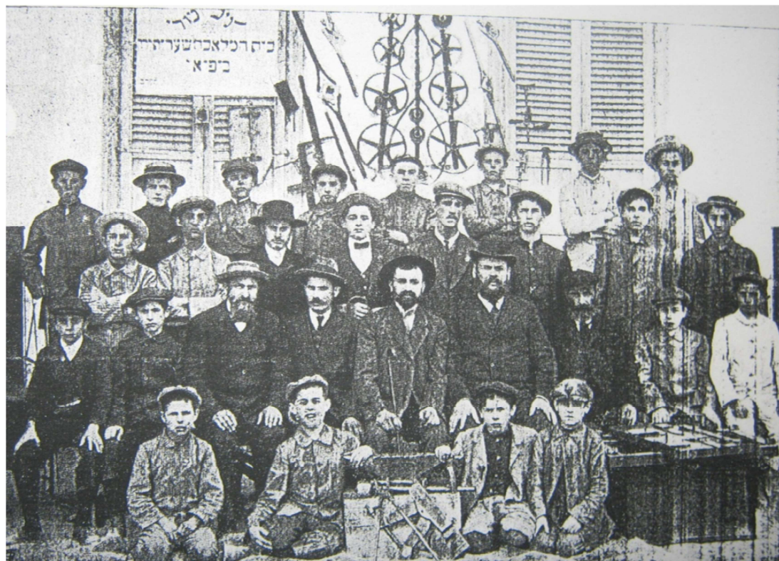
תמונה נדירה של תלמידי בית-המלאכה 'שערי תורה'