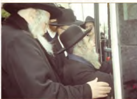
כ"ק האדמו"ר מגור עם רבנו בנסיעה לשוב קדימה