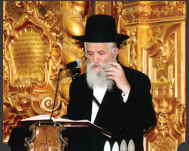
מאמר זיכרון במלאות השלושים להסתלקותו