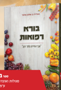
ספר בורא רפואות סגולות ואוצרות הבריות מהצומח ע"פ המקורות על התורה