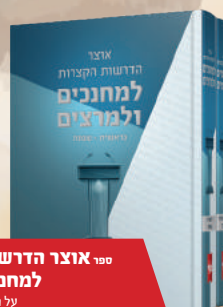
ספר אוצר הדרשות הקצרות למחנכים ומרצים על חמשה חומשי תורה מבוסס ע"פ גליונות אפריון שלמה