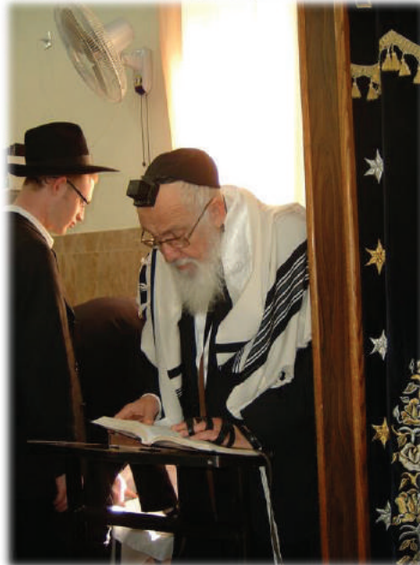
עם מרן הגר"י ש אלישיב זצ"ל