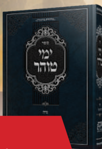
ספר ימי טוהר הלכות נדה