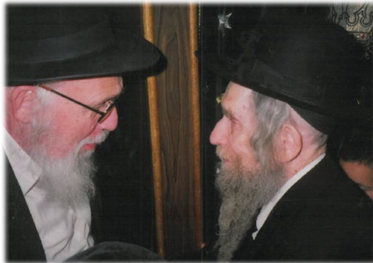
עם מרן הגר"י זצ"ל שטיינמן