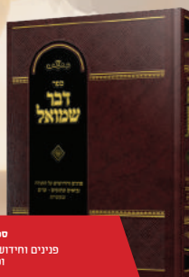
ספר דבר שמואל פנינים וחיידשים על התורה, נביאים, וכתובים ש"ס ומעשיות.