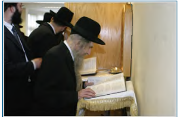
בעבודת התפלה, במתינות ובשוב הדעת

זהו כחה של תפלה, וחזקה עליה שאינה שבה ריקם.