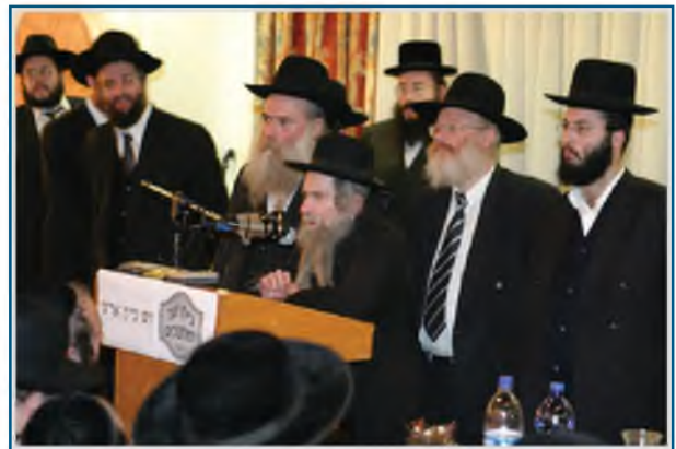
רַבֵּנוּ נוֹאֵם בַּיּוֹם עִיוֹן אֶרְצֵי לְמַחֲנֵכִים בִּירוּשָׁלַיִם

אַבְל הִבֵּה נִרְאָה מָה כְּתוּב בַּתּוֹרָה – כִּי יִדְעֹתִיו (דִּהְיִינוּ שֶׁחֲבַבְתִּי אוֹתוֹ) לְמַעַן אֲשֶׁר יִצְוֶה אֶת בְּנָיו וְאֶת בֵּיתוֹ אַחֲרָיו וְשִׁמְרוּ דְרָךְ ה'! הַקֵּב"ה חֲבַב אֶת אַבְרָהָם כִּי חֲנֹךְ כָּרְאוּ אֶת הַיְלָדִים שֶׁלוֹ!