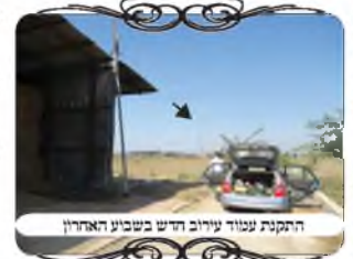
התקנת עמוד עירוב חדש במושב האחרון

בפעילות של בדיקת העירובים ותיקון עירובים, לא שקטו במוקד העירוב גם בתקופת הקורונה ובזמן הסגר, הצוות יצא לכל מקום בעזרת אישורי עבודה חיונית, ופעל לקדם ולתקן את העירובים בישושים ברחבי הארץ. אחד מהמקומות שהגענו בשבוע שעבר, היה במושב באזור קרית מלאכי, שיש בו שליח חב"ד המשמש רב במקום, ומתמסר לעשות שיעורים ולרומם את כל ענייני הדת, כמו"כ הוא בודק את העירוב ומתקן את החוטים שנקרעים. בתקופה האחרונה הוא פנה אל הועד של המושב ואמר שצריך לעשות כמה עמודים חדשים, מפני שיש לו מקומות שנהרסו העמודים. אך העניינים התעכבו זמן רב, עד שכעת הגיעה עת רצון, ואישור את התקציב הנדרש לתיקון העירוב בתיקונים ההכרחיים ביותר. כשהגענו למקום גילינו כמה תיקון היה מוכרח.