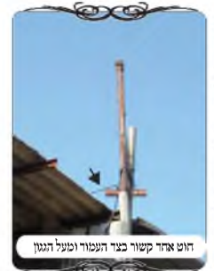
חוט ארוך קשור בצד העמוד וטעל הגגו

אחורי אחד מהבתים היה עמוד שנהרס ונחתך, וכיון שלא היה עמוד לקשור אליו את החוט, לקחו צינור ברזל קצר, וחיברו אותו בגובה צמוד לגג של הרפת שהיתה בסמוך, וקשרו את החוט מעל הצינור הזה. במבט ראשון היה נראה שזה צורת הפתח כשרה, ואין בה בעיה. אבל לאחר התבוננות קצרה רואים שהצינור אינו כשר לעמוד של צורת הפתח, כי הוא אינו מגיע עד הקרקע, וכותב השו"ע (סי' שס"ג ס"י, וברמ"א ס"ז) שכל לחי או עמוד צריך להתחיל תוך ג' טפחים לקרקע, ואם הוא מתחיל מעל י' טפחים, הרי הוא פסול משום דין מחיצה תלויה. במקרה זה לא היה ניתן לעשות לחי לפני העמוד, שיהיה במקום עמוד, כיון שהעמוד צמוד לגגו של רפת, ואם ישימו לחי לפניו, הוא יהיה תחת הגגו, והגגו יפסול אותו משום דין גג הבולט בין הלחי לחוט, שכתב המשנ"ב (סי' שס"ג ס"ק קי"ב) שאינו כשר. וראה בגליון הקודם מה שבארנו בדין זה.