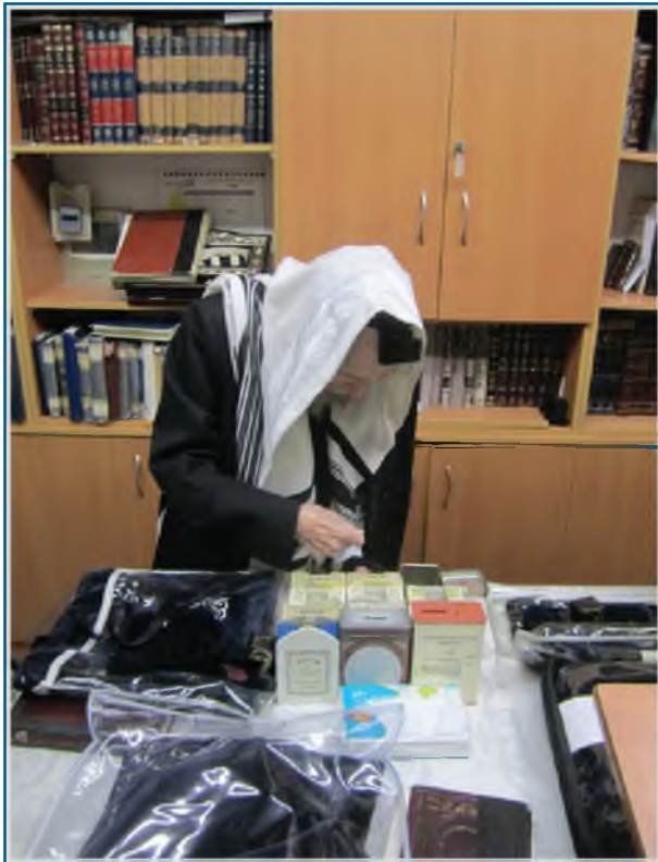
רַבֵּנוּ נוֹתֵן צֶדֶקָה לִפְנֵי שְׁחִירֵית

אִם יְהוּדֵי זֹכֵר וּמֵאֲמִין כִּי כָּל עֲגָמַת נֶפֶשׁ נִקְבָּעָה בְּשָׁמַיִם בְּרֹאשׁ הַשָּׁנָה, וְהָאָדָם הוּא שׁוֹלֵיחַ בְּלִבָּד, יִהְיֶה לוֹ קֵל יֹתֵר לְסִלַּח, וְאִזְגָּם הַקַּב"ה סוֹלַח לוֹ.