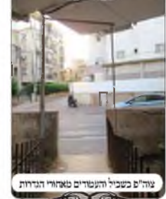
עמודי כשביל העמודים מאחורי הגדרות

והנה מהדברים הנעשים כראוי, קשה ללמוד הלכות, כי לא רואים שום בעיה, רק ניתן לספר איזה בעיה היו יכולים לטעות, וזה קשה לומר במה יכולים לטעות, וגם אין דבר הממחיש את הטעות. לכן עלינו למצוא דוקא את הדברים הבעייתיים, כדי שנוכל ללמוד מהם את ההלכות, אלא שנשמור על חסיון שלא יגלו את המקום, כדי שלא לספר על אף אדם דבר רע ח"ו. ובפרט שברוב המקרים ראוי יותר לציין לשבח על מאמציו במה שהצליח, ורק להאיר את עיניו בדבר החסר.