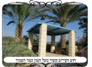
חוט העירוב קשור מעל הגגון כנגד העמוד

באותו ענין יש להביא מקרה אחר שפגשנו בשוב באזור אחר שבאנו לבדוק את העירוב, והיה שם מקום מסובך מחמת ריבוי העצים, שהענפים גדלים ומגיעים לחוטים ומסיטים אותם ממקומם, [והבעיה היא שאם ע"ז החוט יוצא מכנגד העמודים, ובפרט אם משנה זווית מחמת שהענף דוחף אותו, הרי זה פוסל את צורת הפתח]. לכן אחד מהעוסקים בעירובים שדיבר קודם לכן במקום, מצא להם פתרון שהחוט במקום הזה יהיה נמוך, ולא יגיעו אליו ענפי העצים. בסמוך למקום היתה פינת ישיבה, שמעליה יש גגון שיושב על ארבעה עמודי אבן רחבים, וא"כ הוא קשר את החוט על הגגון בחלק שמעל העמוד, וע"ז יושב צורת הפתח, שהרי יש עמוד רחב מתחת החוט.