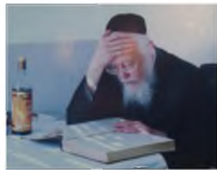
שיכור בינה של תורה. מרן הגרי"ש

כל זה לא מנע ממנו, כמובן, להמשיך בהתמדתו העצומה. גם ביום ששי נהג ללכת לבית המדרש 'אהל שרה', שם שקד על תלמודו במשך שעות ארוכות, ולאחר מכן הגיע לביתו בשעה מדויקת, וסידר את גרות-השמן בפמוטות-השבת, תוך שהוא עושה סלסולי-חיבה עם פתילות הצמר-גפן. כבר אז, עוד לפני כניסת השבת, ראו את השכינה על פניו.