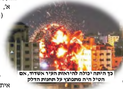
כך היתה יכולה להיראות העיר אשדוד, אם הטיל היה מתפוצץ על תחנות הדלק

ידוע ממרן הסטייפלער בענין כל ה'סימנים' משמים, שהרבה פעמים אין לחוש להם כלל, והביא ראיה ממעשה בועז, דכתב רש"י (דברי הימים א', פרק ב' פסוק י"א) "וחכמים אמרו (מדרש זוטא רות ד' י"ג; ילקוט שמעוני רות, רמז תר"ח) - בשעה שהתחתן בועז עם רות, והרתה, מיד מת בועז". ומובא בחז"ל (יבמות, ע"ז א', ובמהרש"א שם) שבועז חידש את הדרשה ש'עמוני' ולא עמונית, והתיר לעצמו להתחתן עם רות, והתווכחו איתו, והוא לקח עשרה אנשים ופסקו שמותר לו להתחתן עם רות. ויהי ממחרת, 'ותהום כל העיר' על כך שבועז מת. הנה, כך אמרו, יש סימן משמים שבועז טעה!