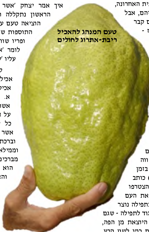
טעם המנהג להאכיל ריבת-אתרוג לחולים

זה טעם נפלא למנהג שנהגו עם ישראל קדושים בענין האתרוג, מנהג שהתפשט בכל תפוצות ישראל, וחוצה עדות.