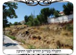
התעלה בעירוב החדש לפני התיקון

אחד מהמקומות שהיתה בעיה למצוא לו פתרון בתכנון העירוב, באחד הרחובות בסוף השכונה, היתה תעלה לניקוז מי הגשמים, שעברה בצידי המדרכה, והגבול של העירוב השכונתי היה צריך הסתיים באותו מקום, [כי ההמשך היה קרפף]. והיו חייבים לעשות מחיצה בתעלה או צורת הפתח מעל התעלה. והנה מחיצה ממש אי אפשר לעשות בתעלה, מפני שהיא תעצור את מי הגשמים שיזרמו בה, ותציף את המדרכה והכביש. יש פתרון לעשות רשות מחוררת, שאין בחורים ג' טפחים, ומדין לבד נחשבים כסתום ומחיצה כשרה, וגם המים עוברים דרכם. אבל למרות זאת הרשת לא תחזיק זמן רב, כי עובדי העיריה באים מידי שנה לנקות ולפנות את ניקוזי המים, והם לא יראו צורך בכך ויעקרו אותה, [כי הרשת עוצרת לכלוכים גדולים כגון שקיות, וסותמת את מרוץ המים]. לכן האפשרות היא רק ע"י צורת הפתח.