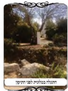
התעלה במלונית לפני התיקון

מקרה דומה לזה, עם פתרון שונה, היה לנו בעירוב אחר, בחג הסוכות בשנה זו, בעירוב שנעשה למלונית קורונה "מעלה החמישה", ששהו בה