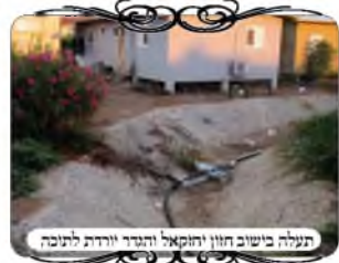
תעלה בשיבו חוון והקוואל והבר יורדת לתוכה

גם בשכונה זו ניסו למצוא פתרון בסגנון זה, אבל זה לא היה פשוט, ונציין כאן את הבעיה לתועלת העוסקים בעירובים. יש מקומות כמו המקומות הנ"ל שיש תעלה עם קירות בטון, ואפשר להצמיד את העמודים לקירות, אבל בתעלות עם דפנות מחול, הרי הדפנות שבשפת התעלה הם בשיפוע, הרי שעמודי הצוה"פ שבתוכה צריכים להיות למרגלות השיפוע, כדי שיעמדו על מקום שדינו כקרקע, ולא על תל שדינו כמחיצה. והעמוד שלמעלה המשמש לצוה"פ שבחוץ, צריך להיות למעלה, כדי שלא יהיה על מדרון שהוא מחיצה, וגם שלא יכנס לתוך הרשות המחולקת, דהיינו לתעלה. וא"כ נוצר רווח של מטר או יותר בין שתי צוה"פ, בין זו שבתוך