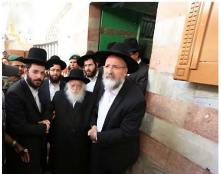
מרן רבינו שליט"א במערת המכפלה