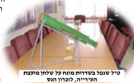
טיל שנפל בשדרות מונח על שלחן מועצת העירייה, לזכרון הנס