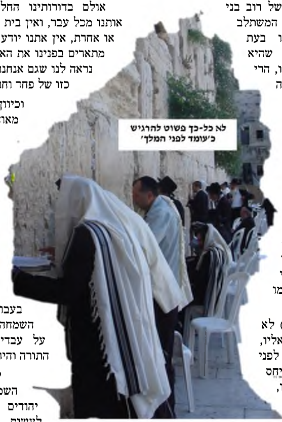
לא כל-כך פשוט להרגיש 'כעומד לפני המלך'

ואז, אם הילד (או אנחנו) לא ירגיש את מה שאתה מדבר אליו, ולא יידע כלל מה-זה לעמוד לפני המלך, אזי לא רק שהוא לא ייחס חשיבות לדברים שאומרים לו, אלא גם ילעג להם. זה יכול להיות בסתר-ליבו, ויתכן