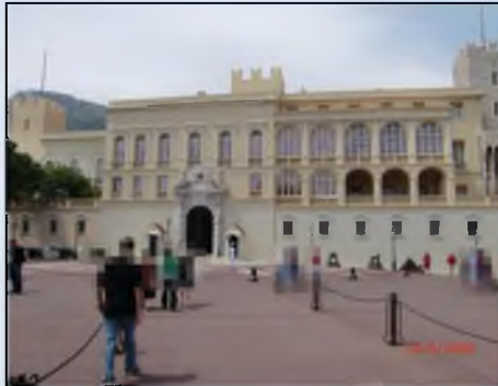
הארמון של נסיכות מונקו

והדברים קל וחומר: אם כל האזרחים והתיירים הנכנסים בשערי הארמון, מצווים להתלבש בצניעות, על אחת כמה וכמה - תושבי-הקבע שלו! וקל וחומר, בן בנו של קל וחומר, שהדבר מחייב כל בת ישראל, שארמונה אינו ממקום באיזו נסיכות זעירנת באירופה, אלא בלב-ליבה של האומה היהודית!