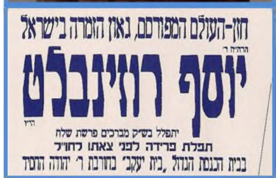
מודעה שפורסמה בחוצות ירושלים