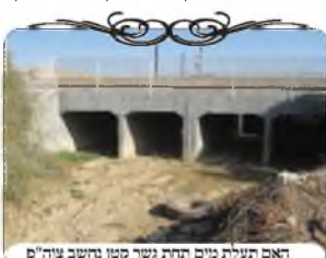
ראם תעלת מים תחת גשר קטן מחשב צו"פ

נסיים את הנושא בשאלה שהתעוררה לנו בהלכה זו בימים אלו בעיר דימונה, שנתבקשנו לתכנן פתרון לעירוב, ובאחד מהמקומות היתה גדר טובה וארוכה, שהיה כדאי להשתמש בה לעירוב, אבל מתחת הקרקע עברה תעלת מים שיש מעליה כמו גשר, שמתחת הגשר התעלה פתוחה מהחלק שבתוך העירוב, למקום שמחוץ לעירוב, וזה פירצה שצריכים לעשות בה צורת הפתח. ואע"פ שמעל הגשר יש מחיצה, זה לא עוזר לסגור את התעלה שהיא כביכול קומה מתחתיה. אך הסתפקנו אולי ניתן להחשיב את הקירות של התעלה לצורת הפתח, כיון שיש קירות ותקרה, ויש בתעלה גובה י' טפחים.