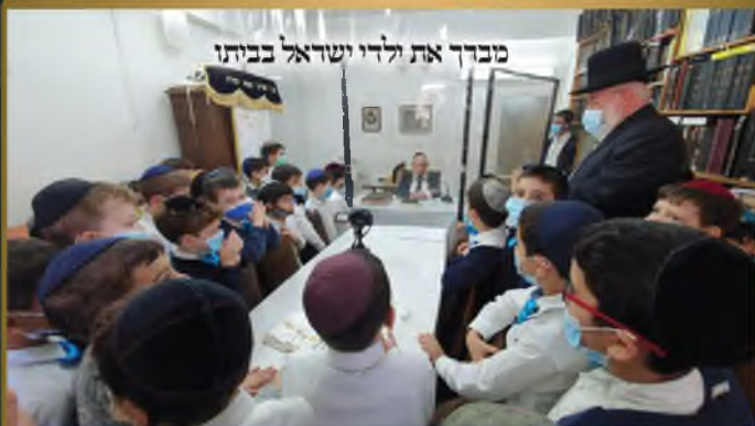
מברך את ולדי ישראל בביתו