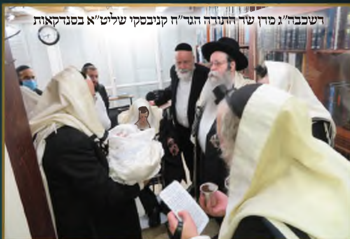
דשכבה"ג מו"ד שד התורה הגד"ח קניבסקי שליט"א בסנדקאות