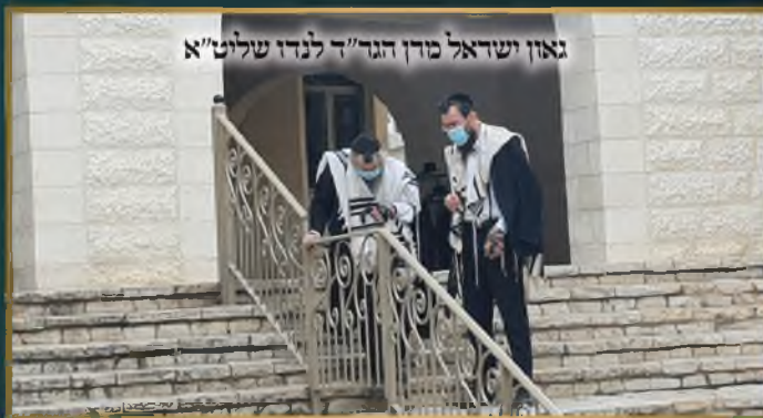
גאון ישראל מו"ד הגד"ד לנדו שליט"א