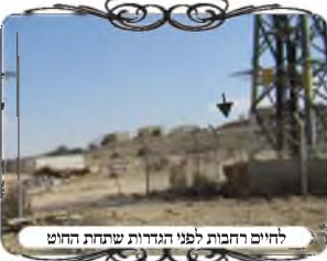
לחיים רחבות לפני הגדרות שתחת החוט

לעומת זאת עסקנו השבוע בעירוב עירוני באחת הערים, שהיתה צורת הפתח שעברה מעל מתחם סגור שמשמש את חברת החשמל, וכיון שהמתחם סגור מד' רוחות, הוא רשות בפני עצמו, והוא מחלק את הפתח ולדעת כמה פוסקים הוא פוסל אותו כי בכל צד נותר רק חצי פתח הפתרון