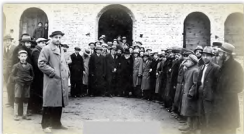
אסני בנין ישיבת