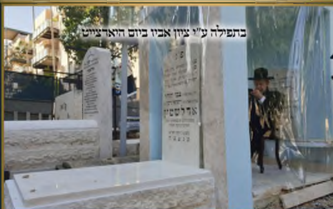
בתפילה ע"י ציון אביו ביום האדלשטיין

רבנו הגדול מו"ד ראש הישיבה הגד"ג אדלשטיין שליט"א