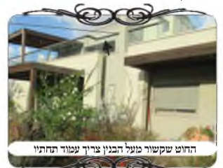
החוט שקושר מעל הבנין צריך עמוד תחתיו