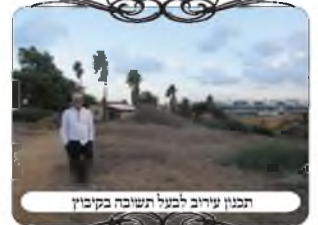
תמונה עירוב לבנין תשובה בקיבוץ

והמקור הוא מדברי המשנה הראשונה במסכת עירובין, שאם המבוי רחב יותר מ"אמות, לא מועיל לו קורה לבד, אלא צריך לעשות צורת הפתח. והקשה המגן אברהם (סי' שס"ג ס"ק כ"ח) מדוע הקורה לבד לא נחשבת צורת הפתח, הרי זה כמו משקוף שיושב מעל שני הבנינים שבראש המבוי. ותיירץ המג"א שמוכח מכאן שהכותל אינו כשר לעמוד של צורת הפתח, אלא צריך להוסיף משהו, או שהקיר באותו מקום יבלוט משאר הקיר. יש אחרונים (מקור חיים) שלמדו שהטעם משום שהכותל שהוא ארוך, הוא מחיצה ולא עמוד, ושיעור אורכו אם הוא ד' אמות או יותר פסול. ויש אחרונים (חזו"א) שנתנו טעם אחר משום שהעמוד צריך לבלוט ולסתום מקצת מהפתח, כעין פצימין, ורק ע"ז צוה"פ נחשבת מחיצה לגדור את הפתח. ויש נפק"מ ביניהם בהעמיד עמוד שווה עם עובי הקיר, ואכמ"ל. ועכ"פ במצב הנ"ל שקשר את החוט מעל הבנין, אין לחוט דין צורת הפתח, אלא צריך להוסיף עמוד לפני הקיר, או לחי שיהיה מכוון תחת החוט.