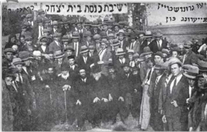
ר' ברוך בער וישיבתו

רבי ברוך בער לא נרגע, באומרו, ומה יהיה עד שהתשובה תגיע, הרי משיח צדקנו עומד להגיע כל רגע.